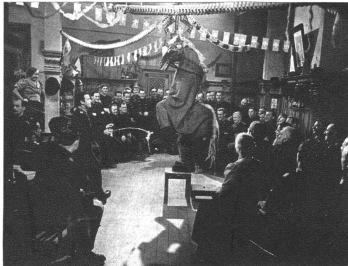
Produktion der Soldaten am Sylvesterabend.