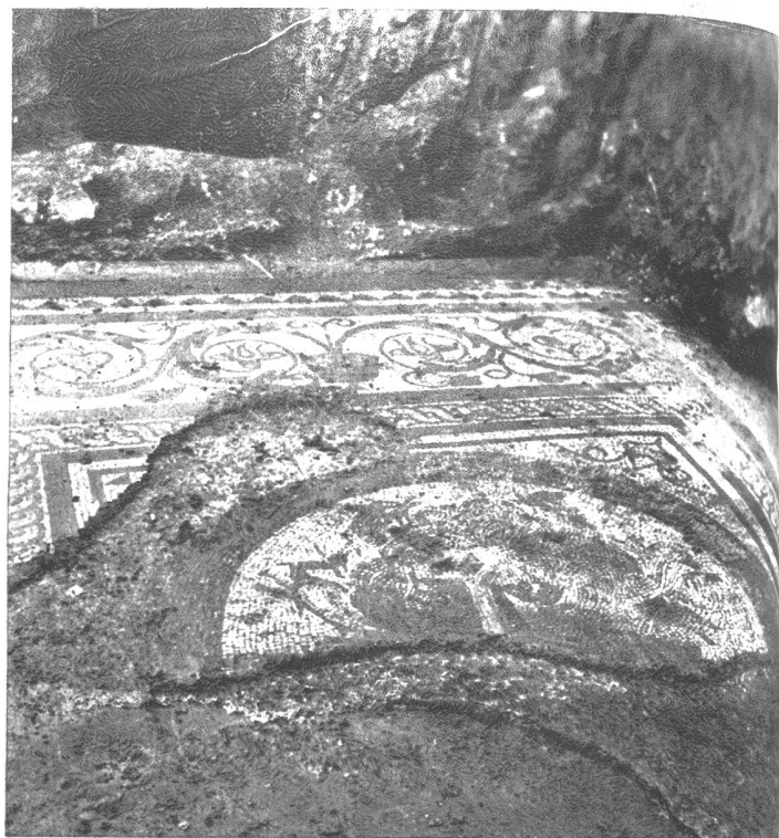
Die Ausgrabungsstätte in Münsingen, wo man die Ueberreste eines alten Herrenhauses freigelegt hatte.