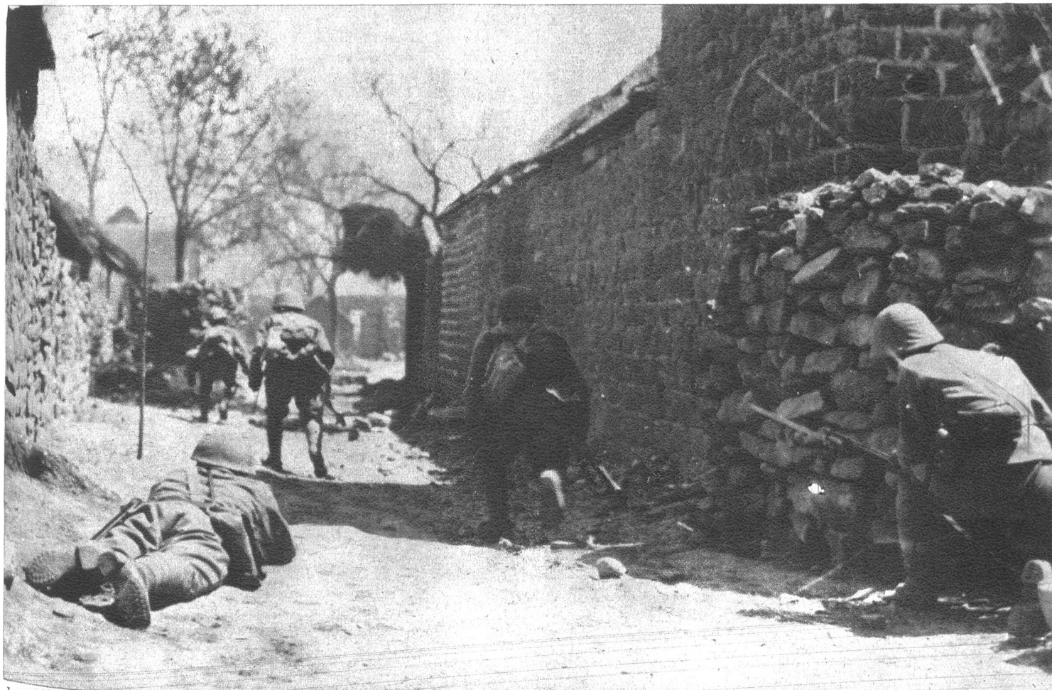
Japanische Infanterie, die in einem Hafen Chinas gelandet ist, stürmt eine von den Schiffsgeschützen zerstörte Ansiedlung.