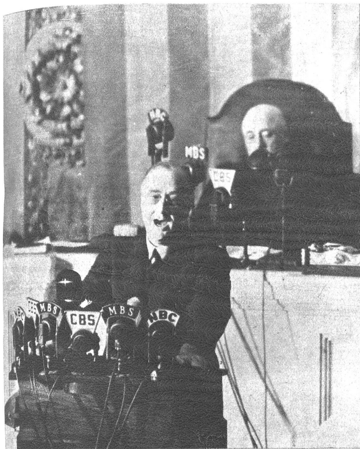
Präsident Roosevelt der Vereinigten Staaten von Nordamerika fordert energische Hilfe für England und warnt vor dem fernen Osten.