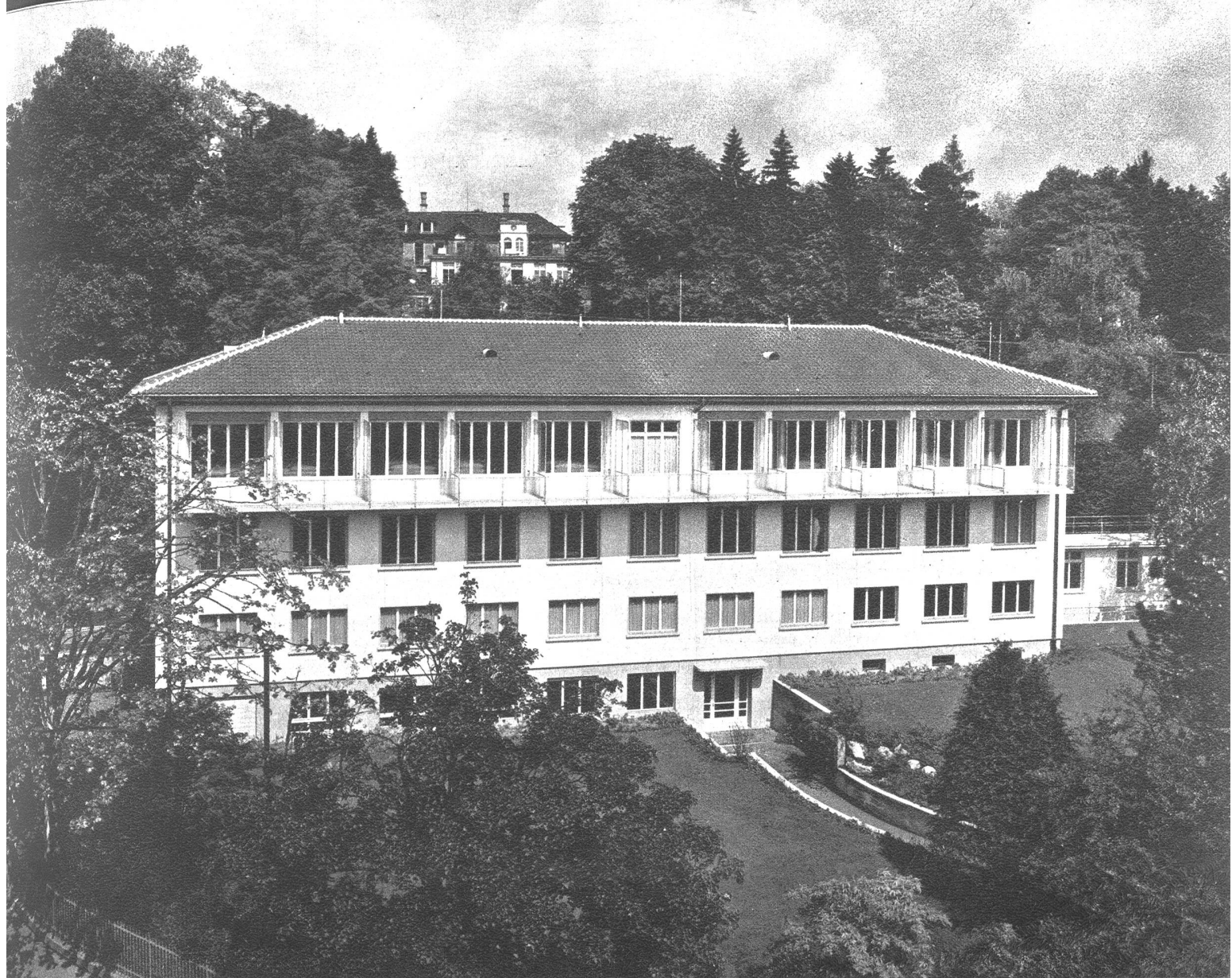
Frontalansicht des Kinderspitals.