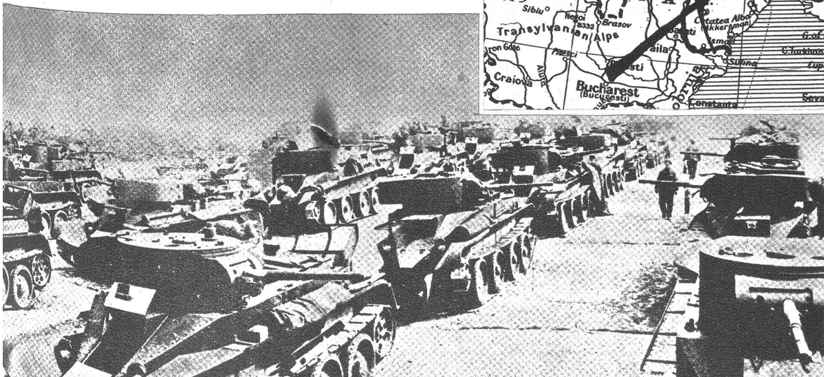
Die russischen Tankformationen scheinen trotz allgemeiner Unterschätzung eine bedeutende Durchschlagskraft zu besitzen und die gemeldeten Erfolge sind durchaus nur auf das Konto dieser motorisierten Einheiten zu setzen.