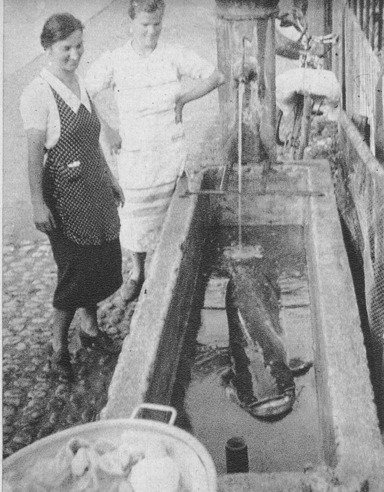
Das sensationelle Prachtsexemplar im Dorfbrunnentrog.