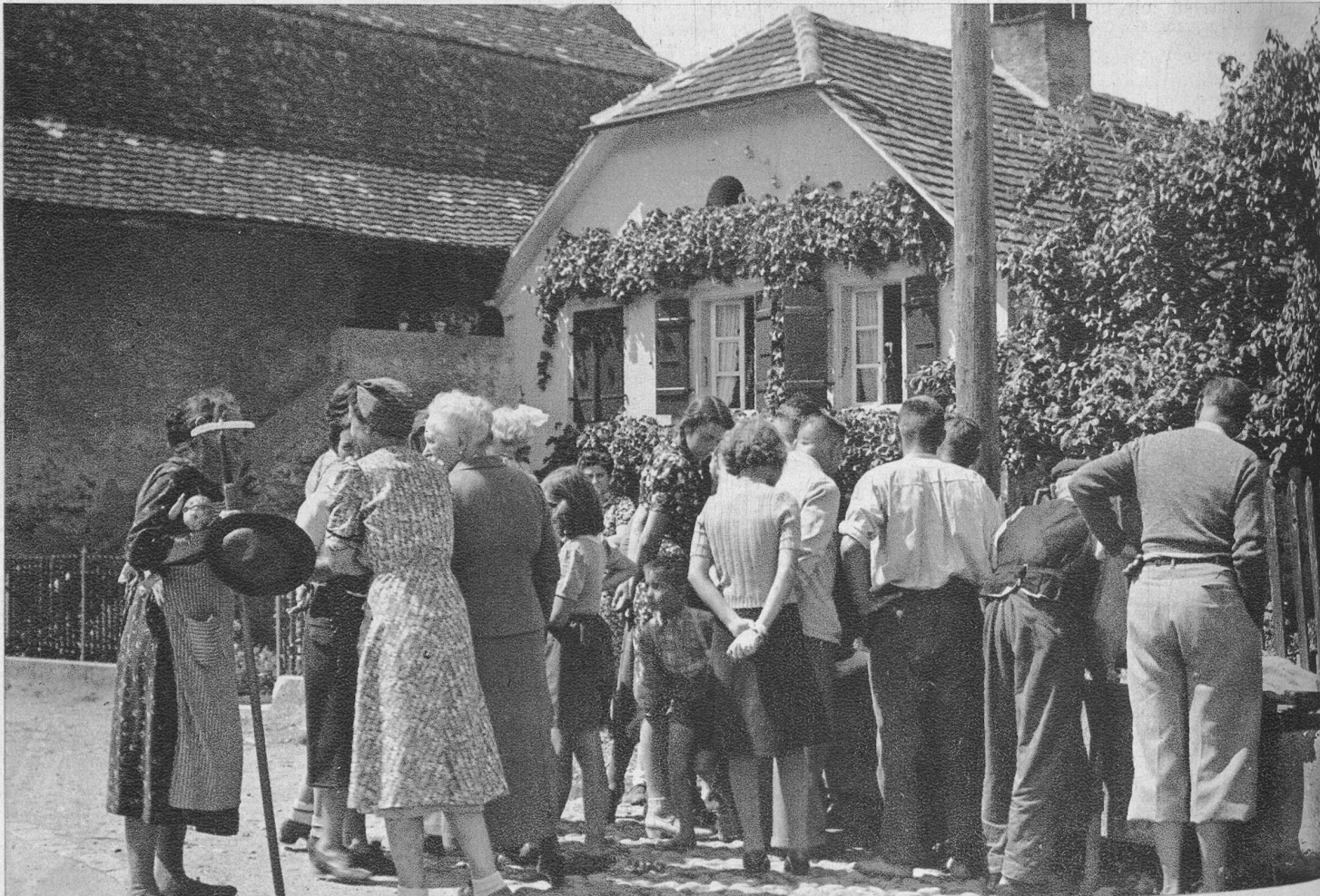
Alles was laufen kann, kommt herbei, um den grossen Wels aus der Nähe zu betrachten. Das Wundern nimmt kein Ende und sprichwörtlich muss jeder seinen Senf dazu geben.