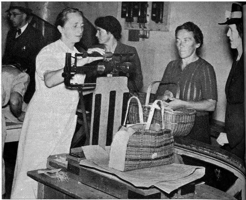
Bei der Dörraktion des zivilen Frauenhilfsdienstes in der Turnhalle des alten Knabenwaisenhauses wird das eingebrachte Gemüse genauestens abgewogen und mit einem Eigentumsformular versehen.