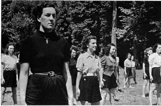
Das Morgenturnen macht die Glieder geschmeidig; alle Übungen werden mit militärischer Genauigkeit ausgeführt.