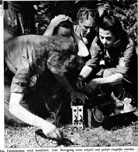
Ein Feldtelefon wird installiert. Jede Bewegung muss schnell und präzise eingeübt werden. Im Ernstfall muss eine Leitung unter den schwierigsten Umständen gelegt werden können.