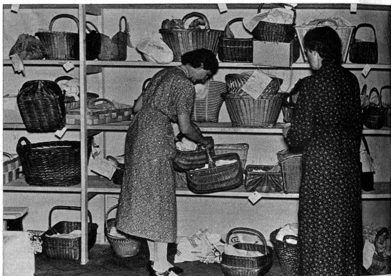
Genaueres Ueberprüfen von Eingang und Ausgang der Körbe, sowohl wie der Waage bildet einen Hauptbestandteil der Aktion. Es gibt weder Verwechslungen noch Verluste.