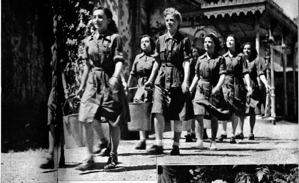
Die Ankunft der Fassmannschaft wird stets mit Applaus begrüßt. Die complementare entwickeln einen unheimlichen Appetit.