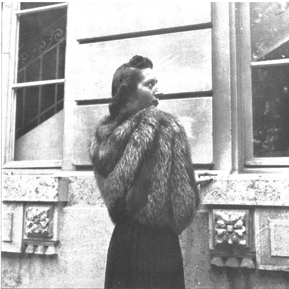
Ein Silberfuchscape zum Abendkleid betont nicht nur die elegante Linie, sondern bildet in der kalten Saison ein notwendiges Kleidungsstück.