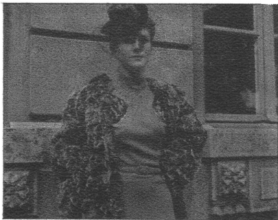
Grau gefärbte Kidkopfjacke, mit interessanten Aermeln und in loser Form gehalten, kommt in der neuen Saison zur Geltung. Dazu ein passender Hut in Seidensamt mit graufrozierem Kopf und schwarzem Rand. Kleine Velourmäschi in Rot bilden eine aparte Garnitur.

Modelle: Ciolina & Cie. A.-G., Bern. Hüte: Frau Gloor, Bern. Pelze: E. Englers Wwe., Bern.