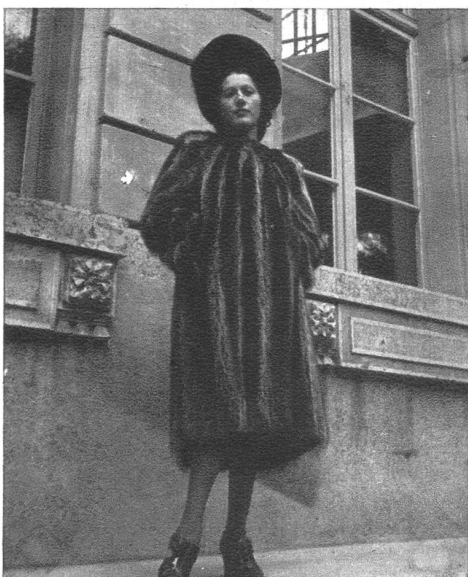
Washbär-Pelzmäntel sind dieses Jahr hoch in Mode und werden besonders bevorzugt. Ein Haarfilzhut dazu betont die jugendliche Note.