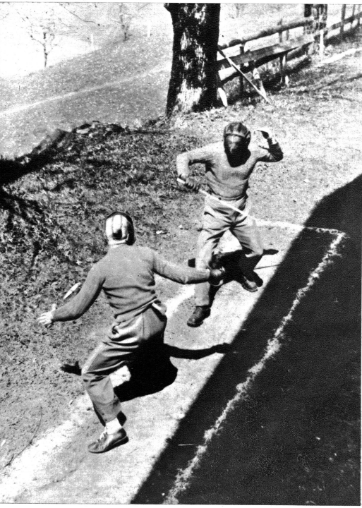
Das Fechten stählt die Muskeln und schärft das Auge. Ausserdem bringt es eine Abwechslung im strengen Dienst.