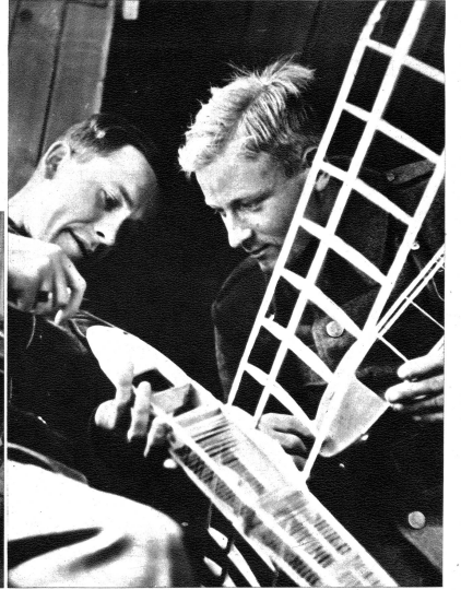
Zwei wissen mehr als einer und so basteln sie gemeinsam ein tadelloses Flugzeugmodell.