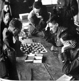
Während der Erholungsstunden streut nicht nur zwei, sondern fesselt hier ein halbes Dutzend.

Die Erholungsstunden im Militärdienst spielen eine grosse Rolle, denn sie bilden das Gegengewicht zu dem oft sehr anstrengenden Dienst. Besonders in abgelegenen Gegenden ist es oft schwierig, den Soldaten eine anregende Freizeitbeschäftigung zu bieten. Doch der gute Wille jedes Einzelnen und der Kameradschaftsgut helfen über alles hinweg. Behördl. III He 5056-5063.