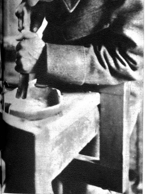
In der Freizeitwerkstatt erhält eine Fruchtschale Form.