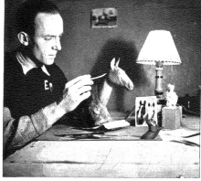
Ein Angestellter der Porzellanfabrik Langenthal kam auf die Idee, sich auch während dem Militärdienst künstlerisch zu betätigen und bald fand er einen Kameraden, der ihm begeistert bei seiner Arbeit half und der es bald fertig brachte, selber neue Gegenstände zu formen.