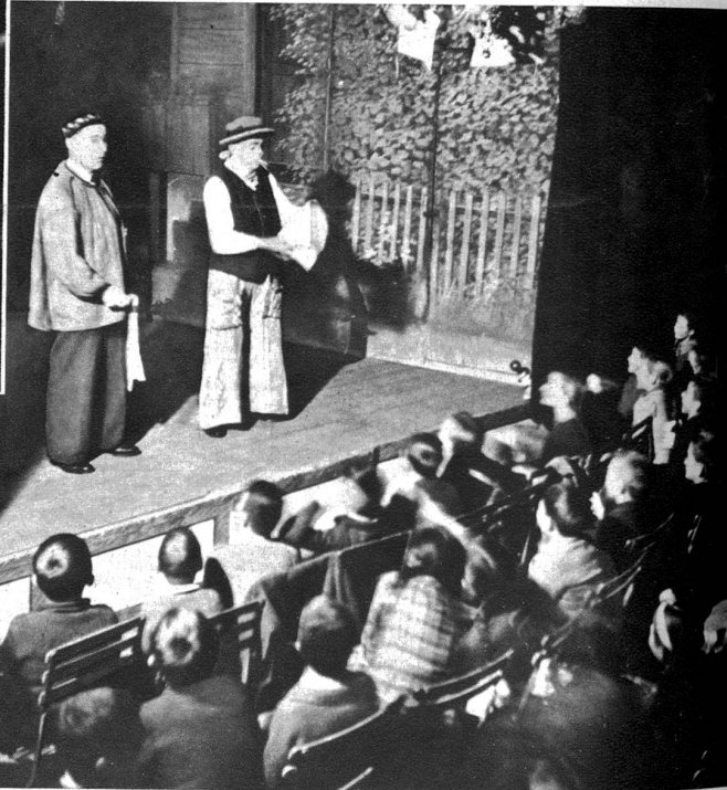
Die Komiker der Kapelle erregen Heiterkeit und Beifall