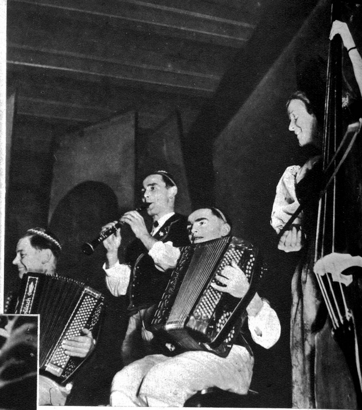
Die Edelwysybuebe spielen auf

Die „Edelwysybuebe“ haben eben in Zäziwil im Rössli in schmissigen Takten einen herrlichen Walzer ausklingen lassen und treten ab. Szenenwechsel: zwei zerlumpte Gesellen, in buntfarbige Kleider gehüllt, treten in das hellrote Licht der kleinen Bühne. Etwas Schminke, in Eile aufgetragen, eine künstliche Nase mit Schnurrbart und die weiten Hosen eines Clowns haben den lustigen Musikanten von vorhin dieses ganz andere Gesicht gegeben. Die Kinder ahnen es nicht. Für sie sind es heitere Spassmacher von irgendwoher, noch nie gesehen, nie begegnet. Für unsere kleinen Gäste beginnt nun ein fröhliches Spiel, an welches sie später noch manchmal gerne zurückdenken werden. Wohl kaum haben diese Bauernkinder schon einmal so ge-