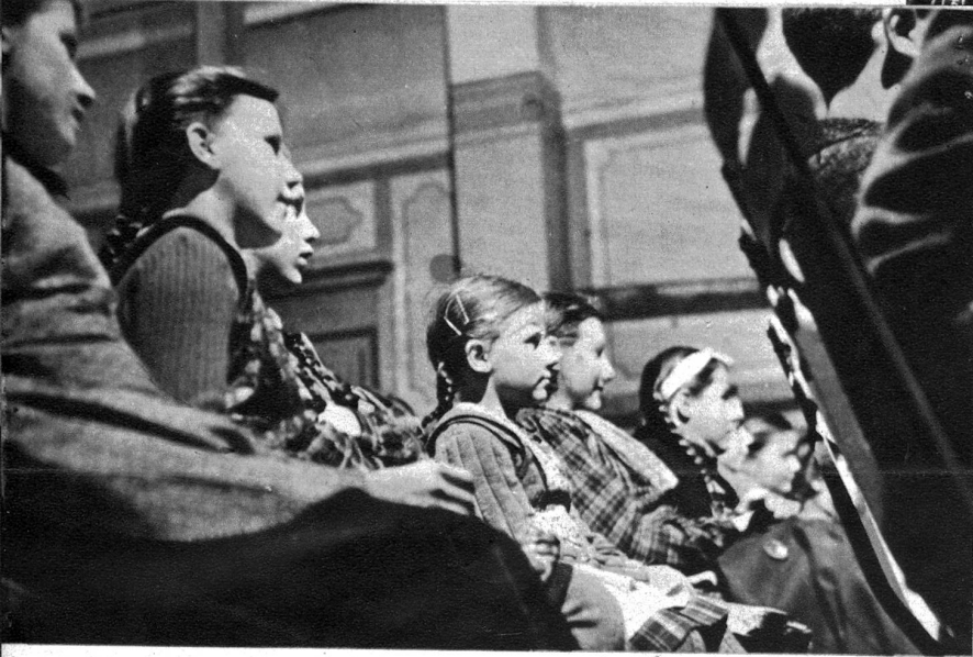
Kinder sind dankbare Zuschauer