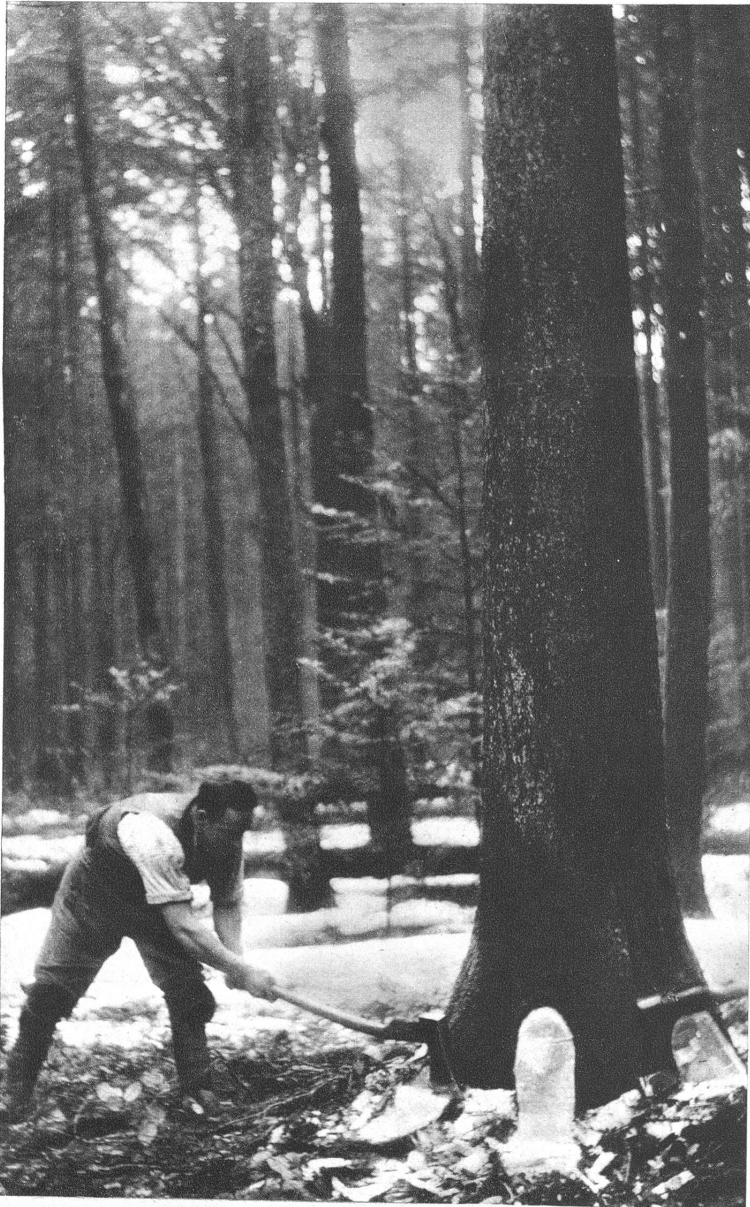
Das Schlagen der Bäume erfordert Sachkenntnis, Kraft und viel Geschicklichkeit, denn das Fallen der Bäume wird im voraus bestimmt und berechnet, damit das Jungholz nicht beschädigt wird