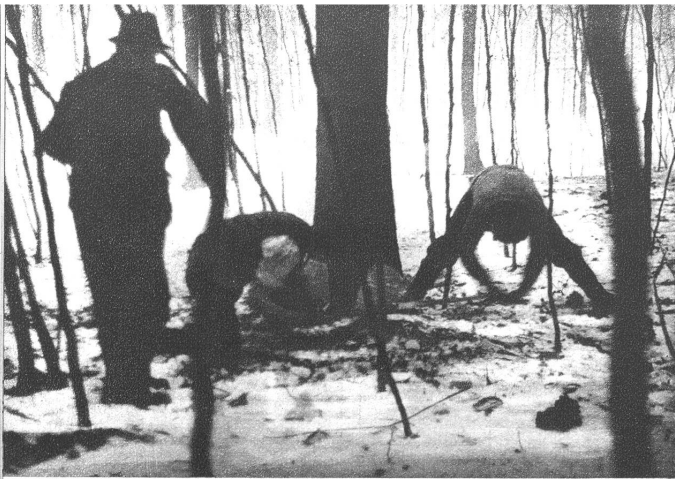
Die vom Förster zum Schlagen frei gegebenen Bäume werden bezeichnet, nummeriert und erst dann abgeholzt