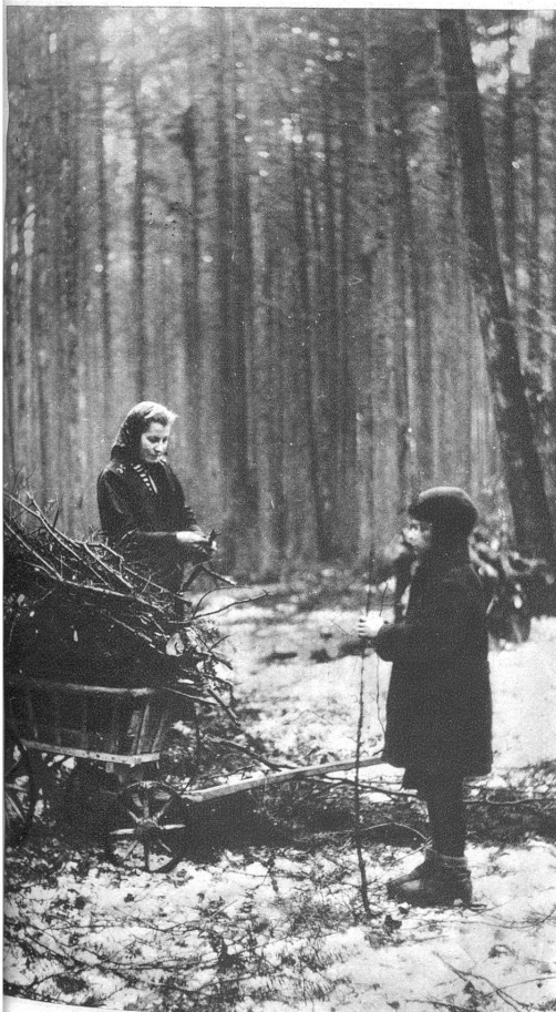
Auch das Abfallholz wird sorgfältig gesammelt und ist ein billiges Brennmaterial

lich lautes Treiben in den Wäldern einsetzt, und zwar dann, wenn die Menschen vorsorgen müssen und ins Holz gehen. Das Holz hat trotz Gas, elektrischer Kraft, Kohle und Koks immer noch seinen Heizwert behalten, den wir heute erst recht wirklich zu schätzen wissen. Jedes Stück Holz oder Bündel Wedelen sind ein kleines Gut, und wer nicht in seiner Jugend das Knistern des Holzes im Ofen oder Kamin gehört und den Duft desselben gespürt hat, ist wirklich um manchen schönen Eindruck und manche schöne Erinnerung ärmer.