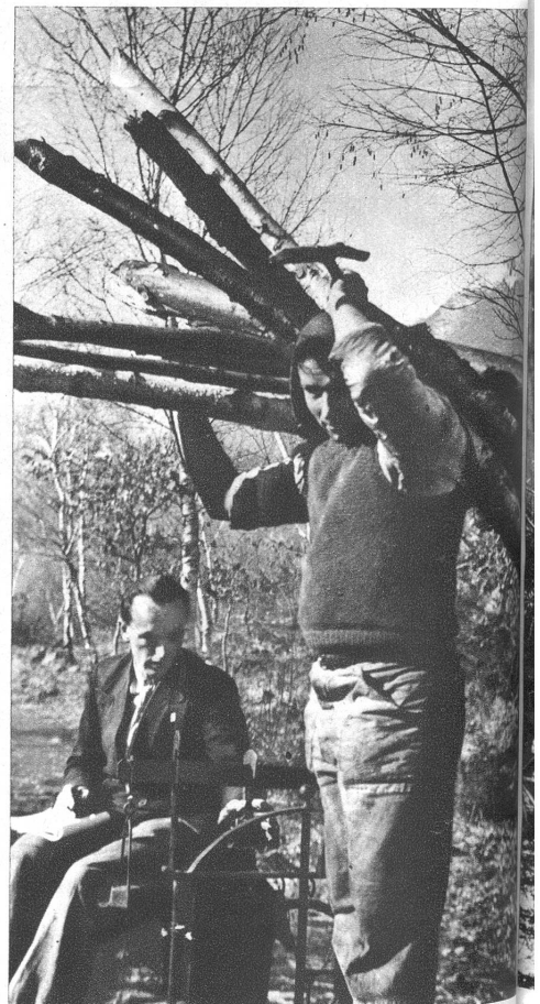
Das eingebrachte Holz wird gewogen

Eigentümlich ist der Eindruck, den uns die Wälder vermitteln. Mitten drin fühlt man sich irgendwie klein und ring und zur Winterszeit, wenn das fröhliche Leben in den Bäumen seinen Ausklang gefunden hat, meint man wirklich, in eine andere Welt eingedrungen zu sein. Alles still und nur wenn man viel Glück hat, kann man hier und da noch flüchtiges Wild sichten und wehmütig die Spurenbetrachten. Immerhin gibt es Zeiten, wo neues und st