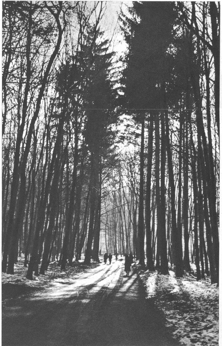
Motiv aus dem Dählhölzliwald in Bern