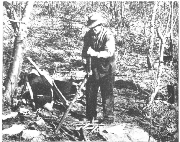
Die Rodung des Kleinholzes wird durch die Hilfskräfte besorgt und man Alte kann sich damit noch ein paar Batzen verdienen