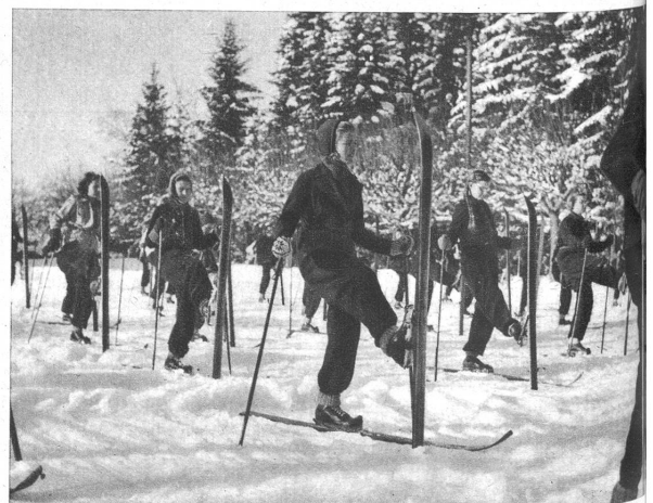
Skiturnen: Die Spitzkehre wird zerlegt