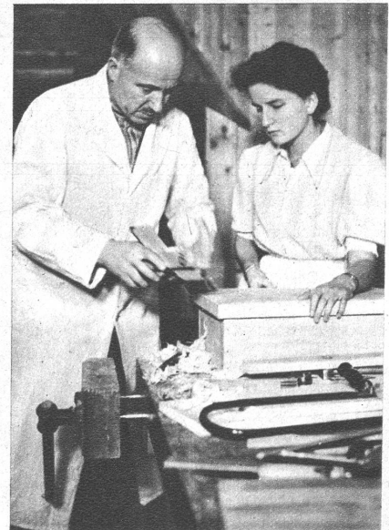
Herr Doktor prüft, ob der Deckel ganz genau passt

Links: Ein Blick in unsere Werkstatt! Ist das ein Leben, wenn ein Dutzend Töchter ihre Säge durchs Holz ziehen, hämmern und feilen und hobeln! Und welche Freude, welcher Stolz, wenn das hölzerne Auto, die Wiege oder Stall fertig als Eigenwerk dasteht!