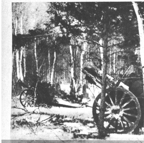
Trotz ungünstiger Verhältnisse vermögen die Russen ihre Artillerie vorzubringen und nehmen die deutschen Stellungen unter wirksamem Feuer.

Die Strapazen, denen die deutschen Truppen ausgesetzt sind, bedeuten wirklich eine Maximalbelastung. Sie verstehen sich die Soldaten darauf, auch im Winter Hilfsmittel zu verwenden. In den vordersten Wäldern wird rasch ein wärmendes Feuer angezündet. Links: Die Position bei Rzhew soll von den Russen ständig umzingelt sein. Der Kampf um Wjazma erstreckt sich in der 10-km-Zone und für Orel ist auch die Verbindung nach Brijansk unterbrochen.