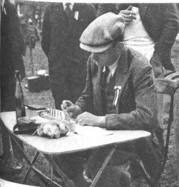
Der Warner. Die Resultate werden in Standblätter eingetragen