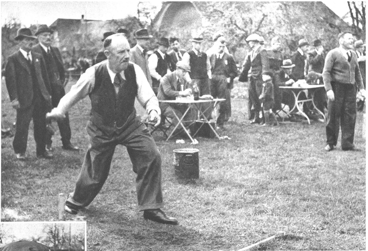
Gut zielen, zwei Schritte Anlauf und weg ist „Er“

Eine dicke Eisenplatte, etwas grösser als die Handfläche, muss möglichst nah an ein bestimmtes Ziel geworfen werden. Je näher, je besser. Es braucht sehr viel Uebung und Gefühl, um regelmässig gute Resultate zu erzielen.