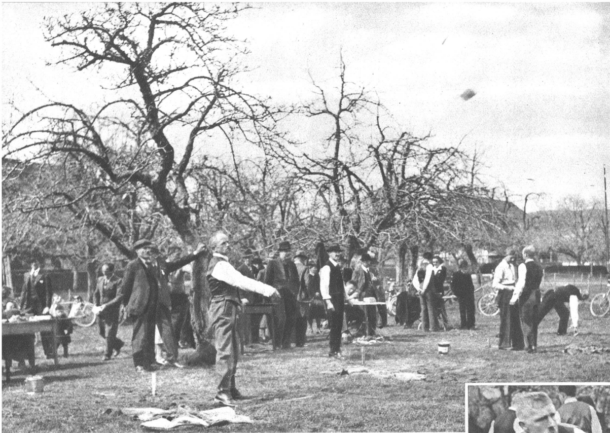
„Platzgerwettschiessen“ in Ostermundigen. Aus dem ganzen Kanton Bern kamen hier die Vereine zusammen, um sich im Wettkampf zu messen