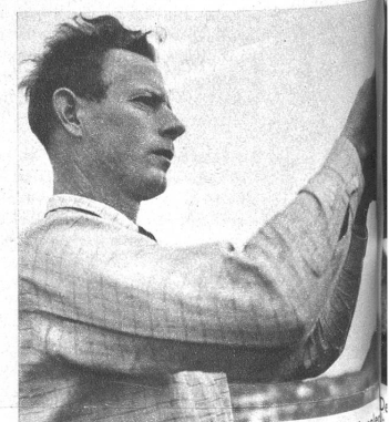
Das Zielen ist eine wirklich individuelle Angelegenheit, die nicht durch eine gedruckte Instruktion erlernt werden kann