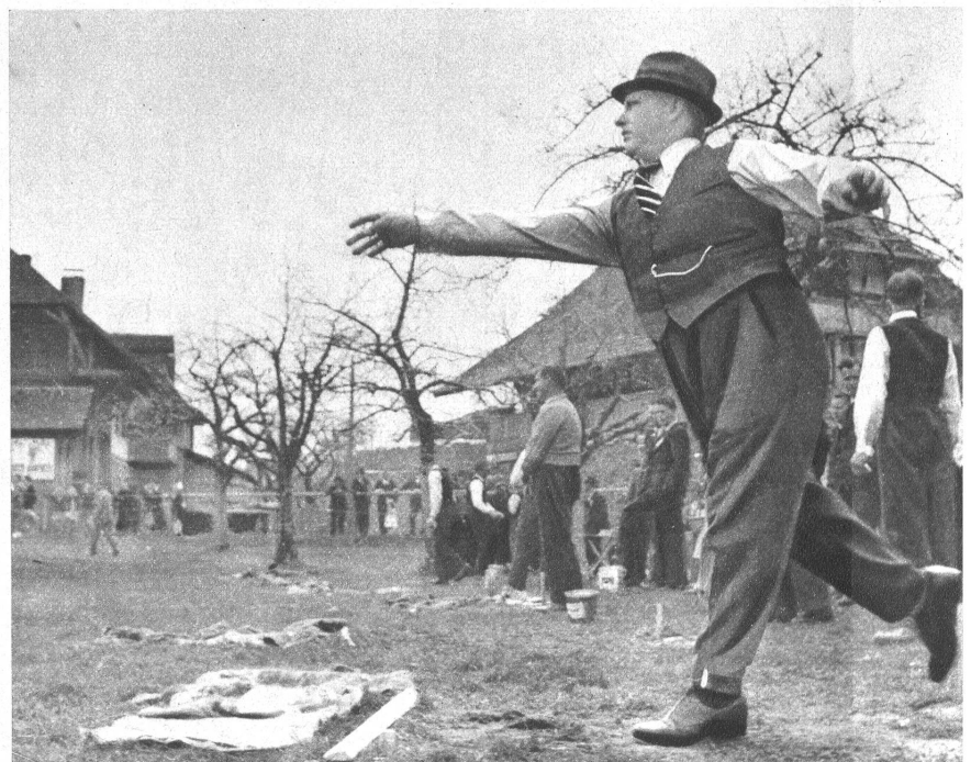
Volle Körperbeherrschung ist Vorbedingung. Jede Bewegung vermittelt Schwungkraft, die oft zu viel des Guten leistet. Ein schöner Schuss