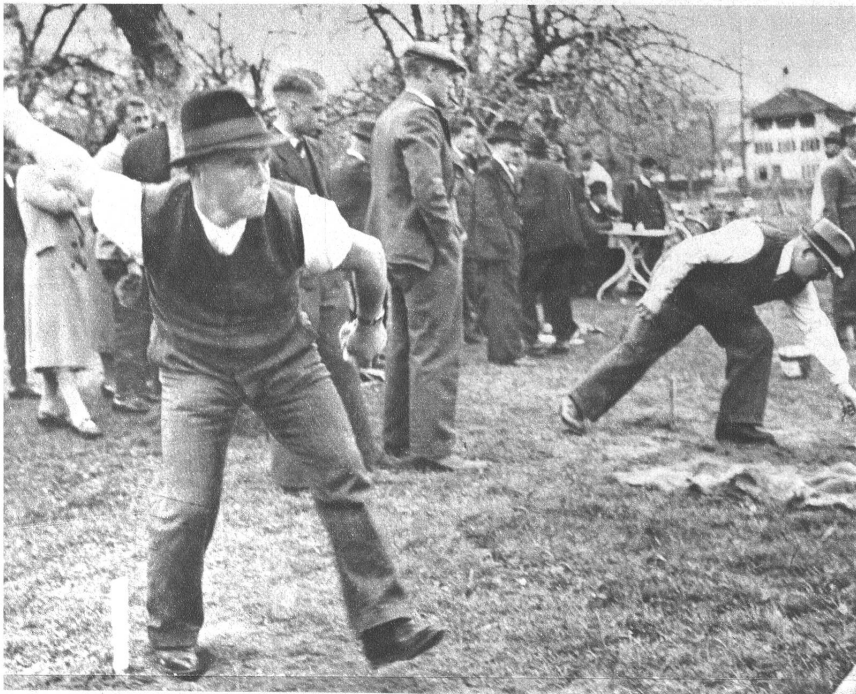
Nume nid na-la, wenn der erste Schuss dem gewünschten Resultat nicht entsprach, so muss es der zweite erst recht schaffen

Diese Vereinigungen umfassen Mitglieder jeden Standes. Zur Hauptsache sind es aber Arbeiter, die sich in ihrer freien Zeit gerne diesem Spiele widmen.