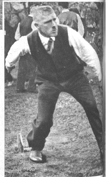
Die Konzentration auf das Ziel ist in der Tat deutlich ausgeprägt