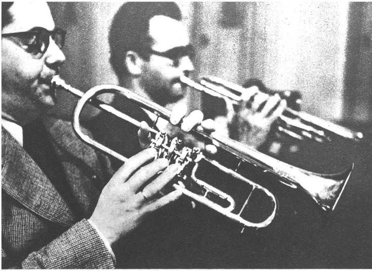
Die Trompete: der „Glanz“ aller Blechinstrumente