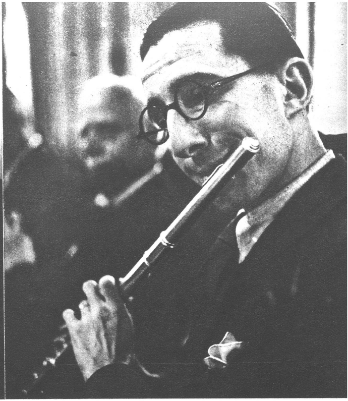
Die Flöte: das „zarteste“ Holz, das schnellste, klangreinste Instrument