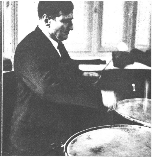
Die Pauke: der rhythmische „Nerv“ eines jeden Orchesters