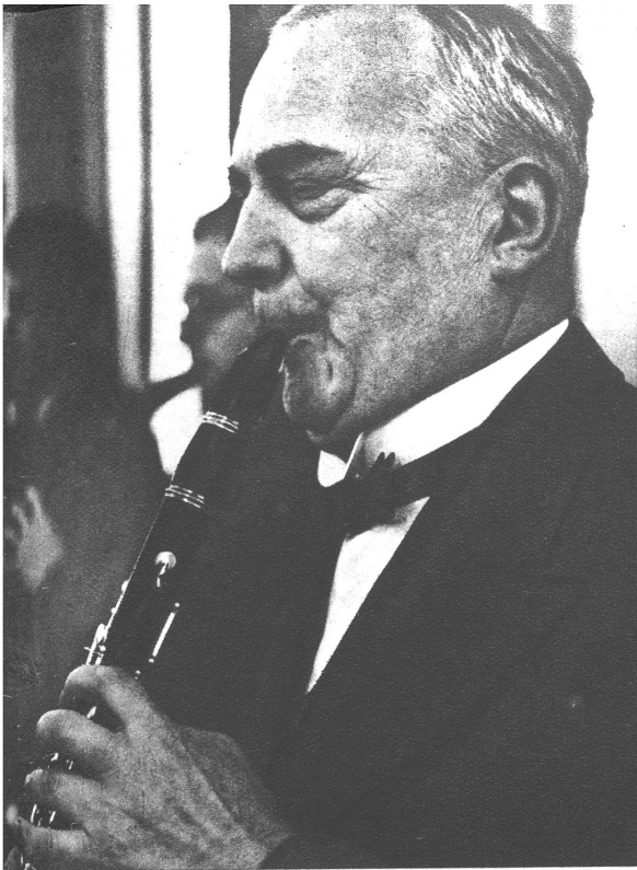
Die Klarinette: das „innigste“ der Holzbläser