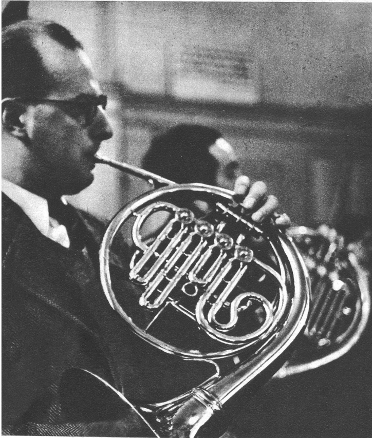
Das Horn: der „Poet“ unter den Blechbläsern, vielseitig verwendbar und schwer zu blasen