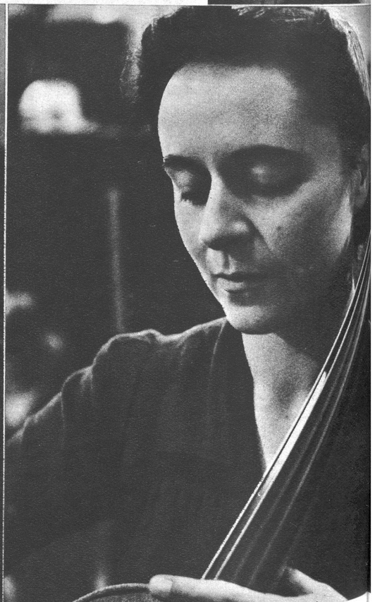
Violoncello: die „Seele“ der Streicher, das Fundament des Streicherorchesters