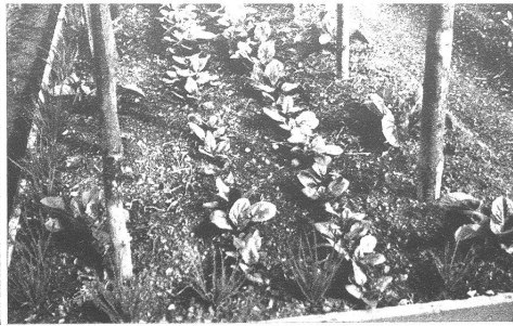
Beet 9 des Pflanzplanes