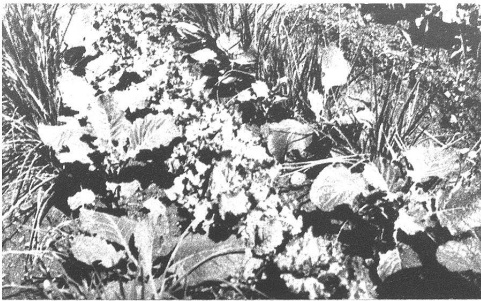
Beet 1 des Pflanzplanes