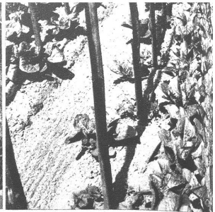
Beet 9a des Pflanzplanes