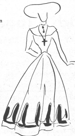
Ein raffiniertes Hütchen aus grobem Stroh mit netter Blumengarnitur