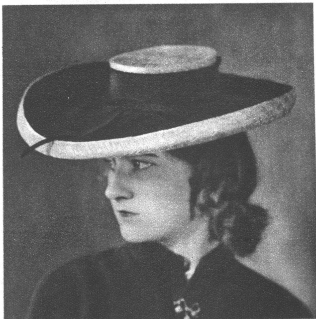
Die klassische Canotierform in grobem Stroh erlebt durch die geschmackvolle Blumengarnitur eine elegante Neugestaltung