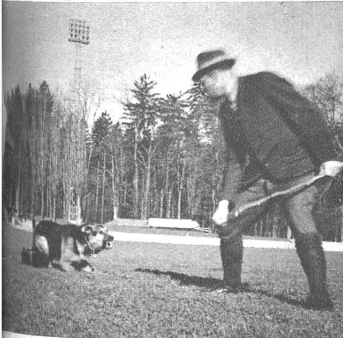
Mit Schuss und Hieb stürzt ein Mann aus dem Dickicht. Energisch setzt sich der Hund für seinen Begleiter zur Wehr und ausser der Schusswaffe kann ihn keine Waffe ausser Gefecht bringen