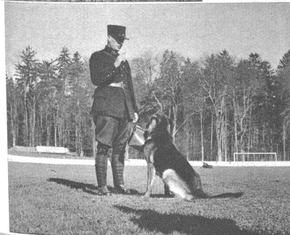
Oben: ... so ergeben überbringt der gleiche Hund den Gegenstand seinem Herrn