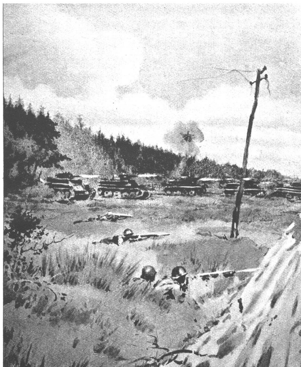
Die Tankschlachten nehmen scheinbar kein Ende. Trotz den schweren Verlusten auf beiden Seiten kämpft man verbissen um jeden Fussbreit