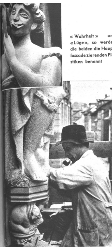
«Wahrheit» und «Lüge», so werden die beiden die Hauptfassade zierenden Plastiken benannt