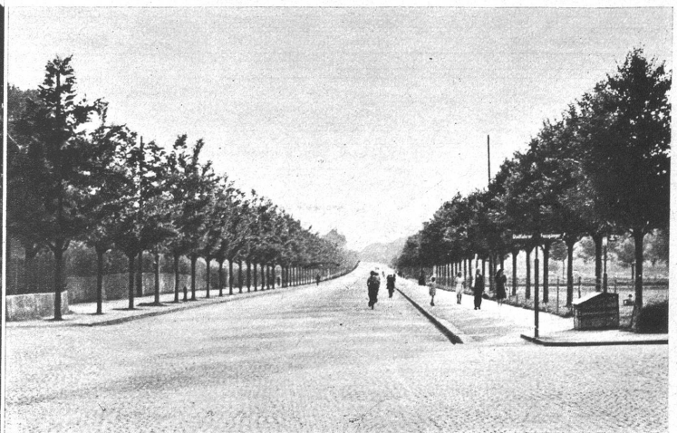
Die neue Schloßstrasse