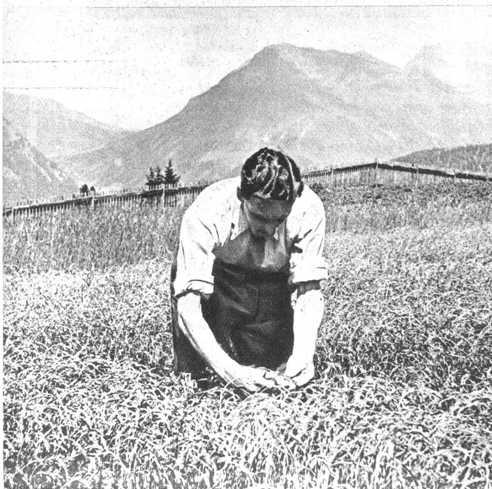
Unten: Mehranbau — 1900 Meter über Meer Flachsbaubau ob Arosa. Der eidgenössischen landwirtschaftlichen Versuchsanstalt ist es gelungen, auch das Alpenland der Volkswirtschaft nutzbar zu machen: In Maran, oben an Arosa, auf dem alpinen Versuchsfeld, gedeiht, wie unser Bild beweist, der Flachsbaubau nach Wunsch. Auf der Versuchspartzele wurden drei Sorten „Holländer“ und „Rigaer“ anfangs Juni gepflanzt, und jetzt, Ende August, steht der Flachs schon über 60 Zentimeter hoch!