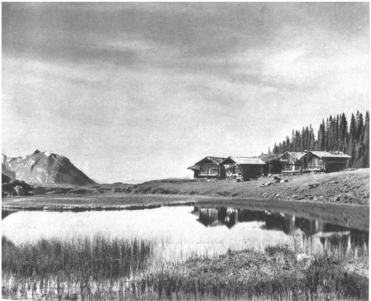
Mägisalp ob Meiringen Beh. bew. am 23. VIII 1942. Nr. 473

W ir sind gewarnt, wie die Menschheit selten gewarnt worden ist. Tausend blutende Wunden rufen uns auf eine Weise zu, wie sie in Reihen von Jahrhunderten der Welt niemals zugerufen haben, es ist dringend, dass wir uns einmal über die Quellen der bürgerlichen und gesellschaftlichen Verirrungen erheben und einmal in der Veredelung unserer Natur selber die Mittel gegen alle die Leiden und all das Elend suchen. Lasst uns Menschen werden, damit wir wieder Bürger, damit wir wieder Staaten werden können!