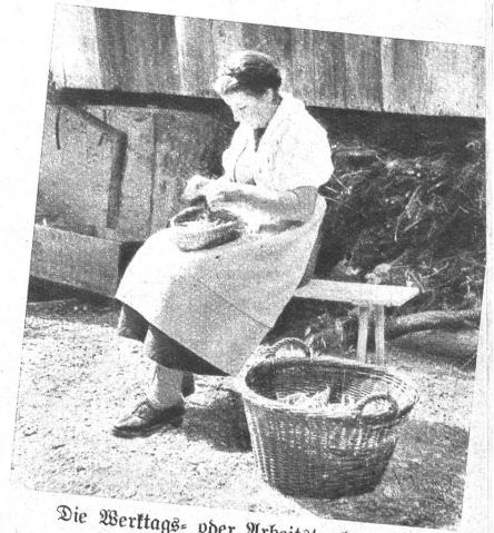
Die Werktags- oder Arbeitstracht ist wo möglich noch einfacher

ne Gruppe von Haslitalerinnen in ihrer Sonntagstracht mit einem schönen, hohen Strohhut