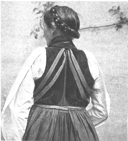
Entsprechend dem allgemeinen Volksbrauch hat auch die Haslitalerin für ihren Hochzeitstag einen besondern Kopfschmuck, die sog. Brautkrone