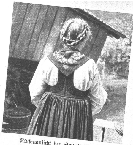
Rückenanicht der Sonntagstracht