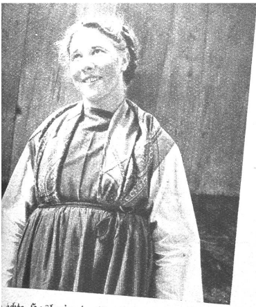
echte Haslerin in ihrer einfachen, aber schönen Sonntagstracht