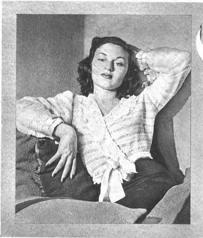
Abb. I. Bettjäckchen. Grösse I. Material: Etwa 400 g Wolle, Stricknadeln und Häkelnadel Nr. 3, Seidenband. Arbeitsweise: Alle Teile des Bettjäckchens nach der Schnittübersicht Ia stricken. Man beginnt die beiden Vorderteile am unteren Rande mit je 82 M. (Maschen), den Rücken mit 84 M. und die Aermel mit je 64 M. (wenn 2 M. 1 cm ergeben). Für das Querstreifenmuster 8 Reihen hin- und zurückgehend rechts, hierauf 1 Reihe abwechselnd 1 M. rechts und 4 Umschläge, dann 1 Reihe rechts, dabei die Umschläge fallen lassen, so dass die M. langgezogen wird, vom Anfang an stets wie