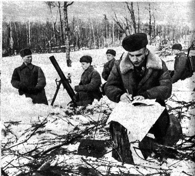
Sowjetrussische Minenwerferbatterie im Raume von Millerowo, welche die deutschen Stellungen unter Beschuss nimmt