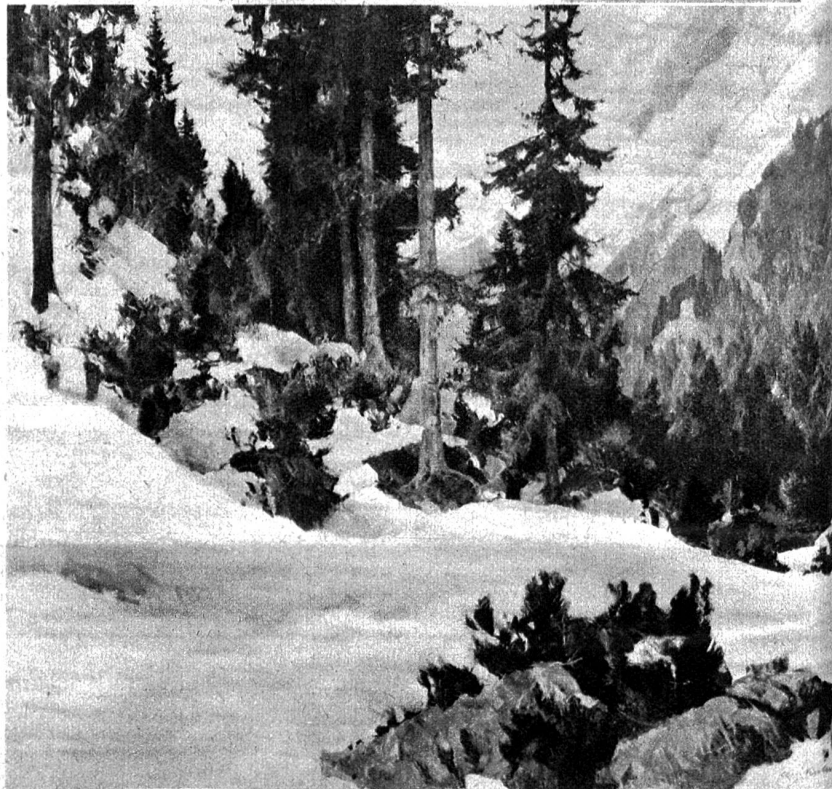
„Am Susten, Schneeschmelze“ von Leo Kalmus, Bern