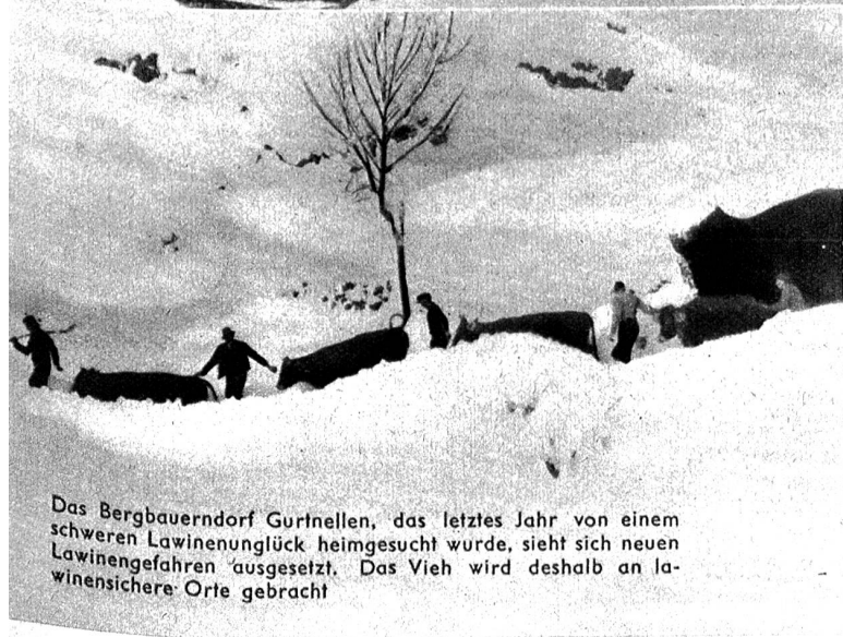
Das Bergbauerndorf Gurtneilen, das letztes Jahr von einem schweren Lawinenglück heimgesucht wurde, sieht sich neuen Lawinengefahren ausgesetzt. Das Vieh wird deshalb an lawinensichere Orte gebracht