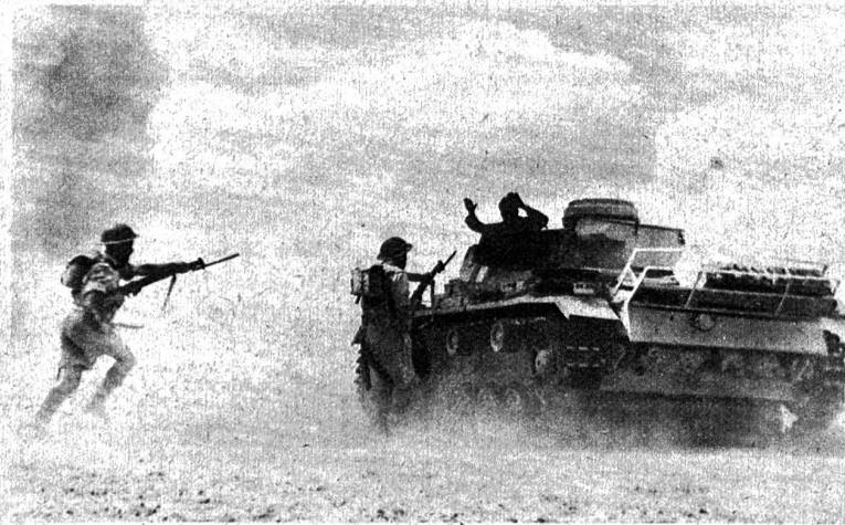
Wüstengefechte in Tripolitaniien. Britische „Vorausabteilungen“, die gerade einen gefechtsunfähig geschossenen deutschen Panzerwagen mit blanker Waffe stürmen ATP