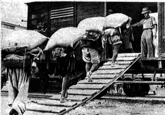
Trotzdem die russische Kriegsproduktion gewaltig angewachsen ist, fließen doch Mengen aus der angelsächsischen Produktion über Persien und die transtranische Bahn nach Russland