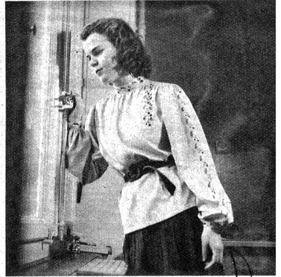
Diese Rohseidenbluse in Naturfarbe ist in der sog. Russenkittelform gearbeitet. Besonders apart wirkt hier die Stickerei in schönem Braun und Gelb.

Die Blusen sind unbestreitbar das beliebteste Kleidungsstück der Frauen, sie haben nie zu viel davon und sind immer glücklich über eine Neuerwerbung. Doch die Bluse ist auch wirklich etwas Praktisches, denn mit ihrer Hilfe kann man den ganzen Tag gut und richtig angezogen sein; sie lässt sich am Morgen ebenso gut wie am Nachmittag oder Abend tragen. Die moderne Bluse, die meistens chemiseförmig gearbeitet ist, wirkt wohl etwas streng, wird sie aber mit einer schönen Stickerei verziert, so gewinnt sie sofort an fraulichem Charme und beionter Eleganz. Sympathisch wirken die Buntstickereien, die den Uniblusen eine fröhliche und jugendliche Note verleihen. Mit nur wenig Arbeitsmitteln und ein bisschen Geduld lassen sich dabei Effekte erzielen, die einen überraschenden Erfolg zeitigen. Neben den Stickereien können aber auch Hohlsäume sehr zur Bereicherung der Blusen beitragen und erst mit deren Hilfe werden sie zum eleganten Kleidungsstück gestempelt.