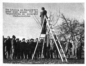
Die Schulung von Baumwärtinnen bildet einen grossen Teil des Tätigkeitsfeldes der kantonalen Obstbauzentralen.