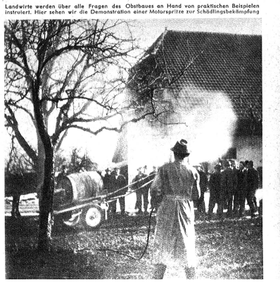
Landwirte werden über alle Fragen des Obstbauers an Hand von praktischen Beispielen instruiert. Hier sehen wir die Demonstration einer Motorspritze zur Schädlingsbekämpfung.