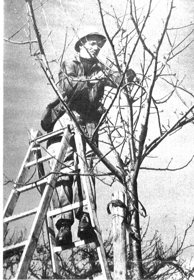
Ein Baumwärtner an der Arbeit. Vor allem handelt es sich um fachgemässes Schneiden der Bäume, ein Gebiet, in welchem die letzten Jahre erfreuliche Fortschritte gebracht haben.