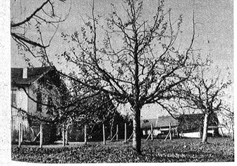
Beispiel eines gepflegten Obstgartens. Solche Bäume bringen Nutzen.