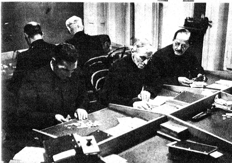
Von 17 Uhr an, wenn die Tour beendet ist, sitzen die Einzieher im Bureau bei der Abrechnung