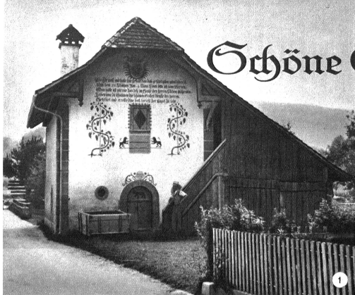
Steinerne Speicher mit Ofenhaus in Riggisberg (Rudolf Pulver). Dieser formschöne und durch Malerei reich verzierte Speicher wurde letzthin mit Hilfe des Berner Heimatschutzes kunstgerecht aufgefrischt

Wenn von Speichern die Rede ist, so denkt man in erster Linie an das Emmental. Es ist sicher, dass dort die mannigfaltigsten, die interessantesten und auch die wertvollsten dieser «Schatzkästlein» des Berner Bauernhofes verstreut sind. Aber auch die übrigen Teile des Bernerlandes, wie Seeland, Mittelland, Guggisbergerland und Seftigland, das Gebiet des Gürbetals, weisen viele schöne und eigenartige Speicher, oft wahre Kunstwerke auf. Im Gürbetal, das reich ist an