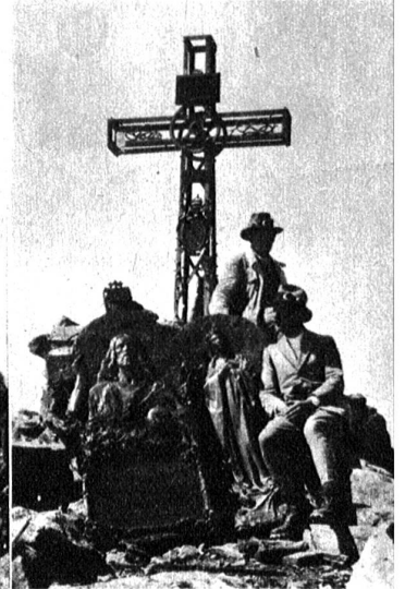
Auf dem Gipfel des Monte Viso