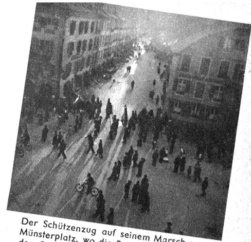
Der Schützenzug auf seinem Marsch zum Münsterplatz, wo die Rangverkündung für den Schiessplatz Ostermundigen stattfand