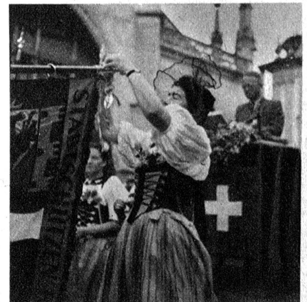
An einem Schützenbanner wird die Auszeichnung befestigt