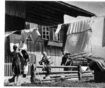
Bild rechts: Inzwischen klopf die Mutter mit den Töchtern draussen auf den Wiesen tüchtig das Bettzeug