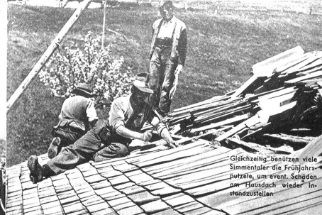
Gleichzeitig benützen viele Simmentaler die Frühjahrsputzzeit, um event. Schrägen am Hausdach wieder Instandzustellen.

Der Aeltli hat mit den Söhnen das Gerüst an der Hauswand befestigt und ist nun mit ihnen hinaufgestiegen, um mit Bürste, Strupper und Seifenwasser Balken um Balken mit vorbildlicher Gründlichkeit abzuwaschen. Inzwischen widmen sich die Mutter und die Töchter den Stuben. Die Simmentaler Bauernstuben sind gewöhnlich niedrig, so dass man Wände und Decken müheios ohne Leiter blank reinigen kann.