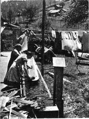
Echte Bauernbänke werden direkt am Brunnenort gewaschen. Da diese wärschaften Bänke und Sessel nicht die feine Politur wie die städtischen Möbel haben, so kann der Reinigungsakt ein bisschen burschikoser vor sich gehen.

Der Aeltli hat mit den Söhnen das Gerüst an der Hauswand befestigt und ist nun mit ihnen hinaufgestiegen, um mit Bürste, Strupper und Seifenwasser Balken um Balken mit vorbildlicher Gründlichkeit abzuwaschen. Inzwischen widmen sich die Mutter und die Töchter den Stuben. Die Simmentaler Bauernstuben sind gewöhnlich niedrig, so dass man Wände und Decken müheios ohne Leiter blank reinigen kann.