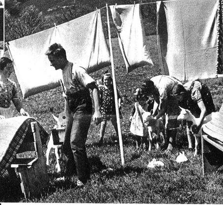
Die ganz Kleinen kommen sich ziemlich verlassen vor und suchen Trost bei den Tieren.