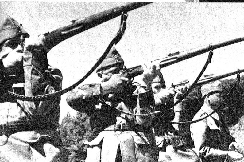
Abmarsch mit klingendem Bataillonsspiel Rechts: Bataillonskommandant bei der Befehlsausgabe Unten: Wettkampf im Kleinkaliber-Schiessen Unten rechts: Mittagsbiwak und Verpflegung

Die Ortswehr hat im Falle einer Kriegsmobilmachung die Aufgabe, die Stadt Bern zu schützen und die Mobilmachung der Feldarmee zu decken. Es ist die Pflicht eines jeden, sein Leben einzusetzen für die Ehre und Freiheit unseres Vaterlandes.