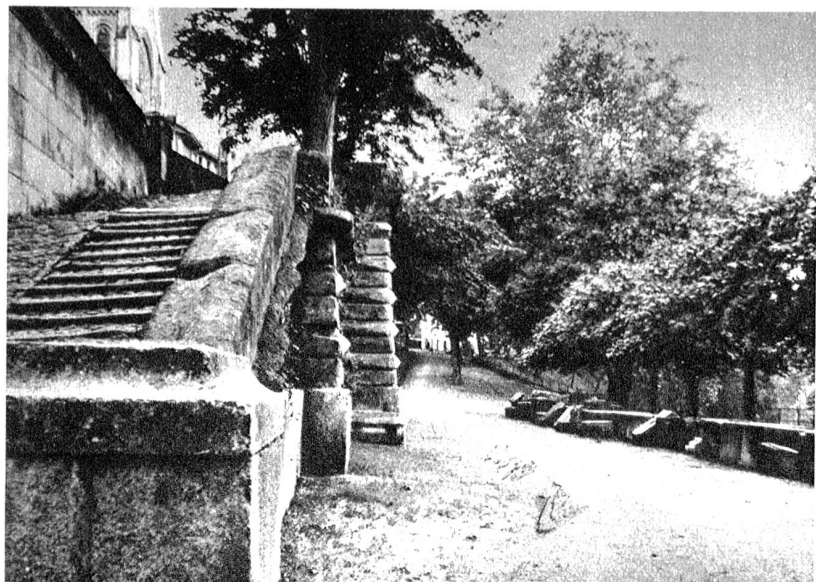
Bild rechts: Die heutige Rathaustrasse, links der Aufstieg zur Postgasshalde, rechts der als Promenade ausgebaute Teil mit Platanen. Grosse Sandsteinquader, die vom Rathausumbau her hier liegengelassen sind, harren weiterer Verwendung