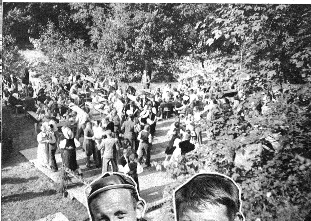
Von Bäumen umgeben, mit Zweigen geschmückt, ist der Tanzboden, der Mittelpunkt der frohen Gesellschaft

Ab und zu steigt ein frischer Jauchzer gegen die Bergspitzen und vermischt sich mit dem Rauschen des Wassers, das mit einem Gletscherhauch dem Thunersee zufließt.