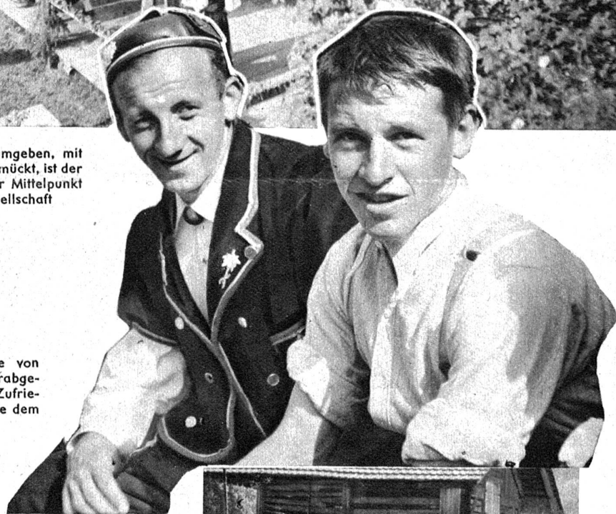
Zuschauer, die von hoher Alp herabgestiegen sind. Zufrieden schauen sie dem Treiben zu