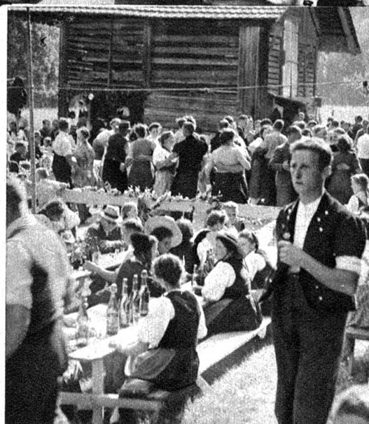
Auf wen wartet wohl der junge Senn?