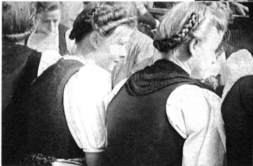
Zwei waschechte Simmentaler-Meitschi