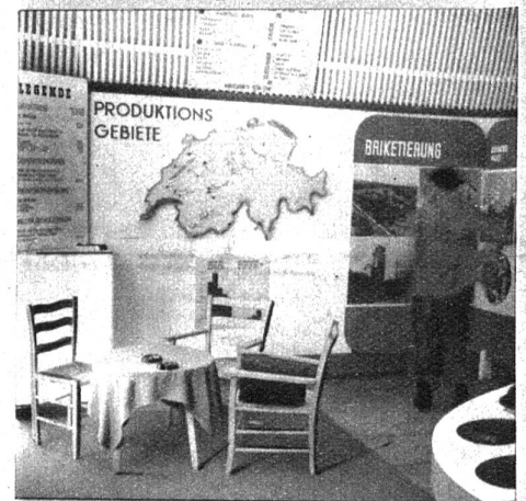
Reiches Anschauungsmaterial vermittelt die Eigenart der Schweizerischen Produktionsgebiete

Das vorbildliche Anschauungsmaterial ermöglicht einen tiefen Einblick in dieses bis heute dem breiten Publikum verschlossen gebliebene Gebiet und gibt den Besuchern einen richtigen Begriff über Qualität und Verwendungsart der einheimischen Brennstoffe.