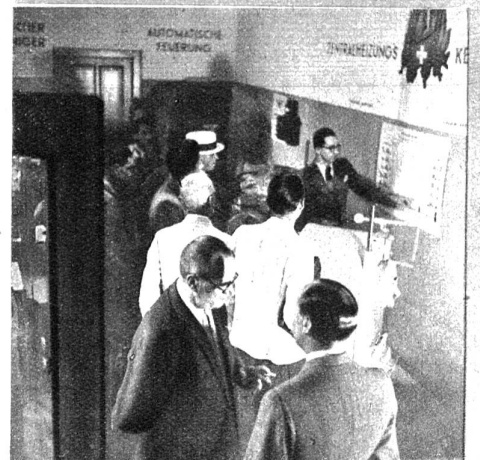
Angeschlossen ist auch eine kleine Ausstellung neuer Feuerungsanlagen für die zweckmässige Verwendung einheimischer Brennstoffe