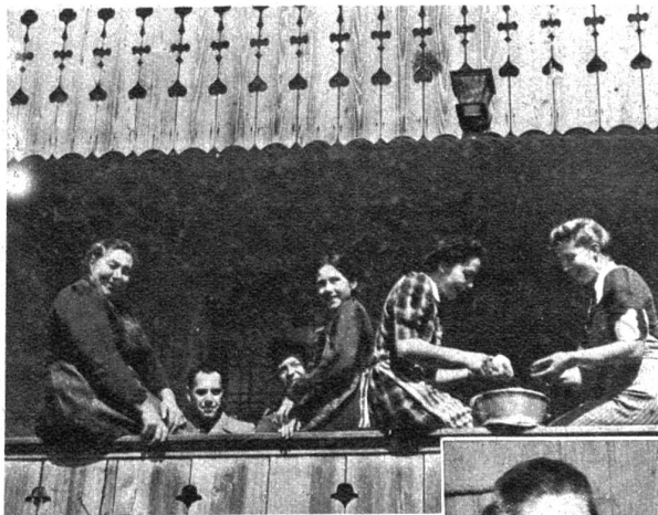
Oben: Es ischt hüt kes dürsch Heu dusse, drum darf me's chli gmüetlich näh. Unten: D'Hüehner nähmis eim übel, we me se einischt wurd vergässe