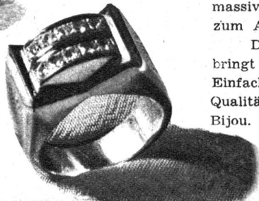
Rechts. Massiver goldener Damenring in der neuen modernen Form mit Brillanten besetzt

hat eine lange Zeit hindurch ein gewisses Standardniveau inne gehabt und nennenswerte Neuschöpfungen waren seltener. In der letzten Zeit dagegen hat besonders die Schweiz in der Bijouteriebranche ganz neue und eigenartige Stücke hervorgebracht, die eine Wiedergeburt der Kunst im Goldhandwerk bedeuten. An der Modenschau der Firmen Kohler und Frey hat die Firma W. Rösch, Uhren und Bijouterie, Bern, eine Kollektion von Schmuckstücken gezeigt, die zu den schönsten gehören, die man in Bern an einer Modenschau gesehen hat. Neben schweren goldenen Halsketten trat die Brosche stark hervor, die von der einfachen Form der Nadel abgehend, sich heute in niedlichen Blumenbouquets mit Edelsteinen besetzt als wahres Schmuckstück für die Frau präsentiert. Auch der Ring hat seine Form in mancher Beziehung geändert. Der kleine, niedliche Reif macht einem schweren massiven, mit Edelsteinen geschmückten Ring Platz, der das Kunsthandwerk richtig zum Ausdruck bringt.