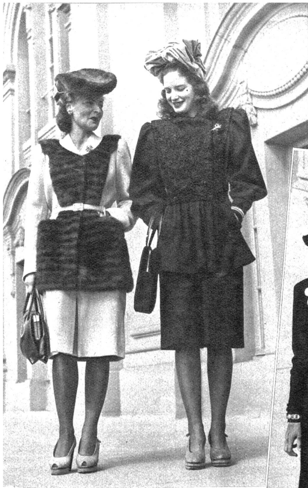
Links: Zwei elegante Kostüme; links in hellbeige mit braunem Pelz garniert, rechts in schwarz mit reichem Astrachanbesatz Unten: Zwei schwarze Nachmittagskleider mit weissen Revers in schöner Stickerei