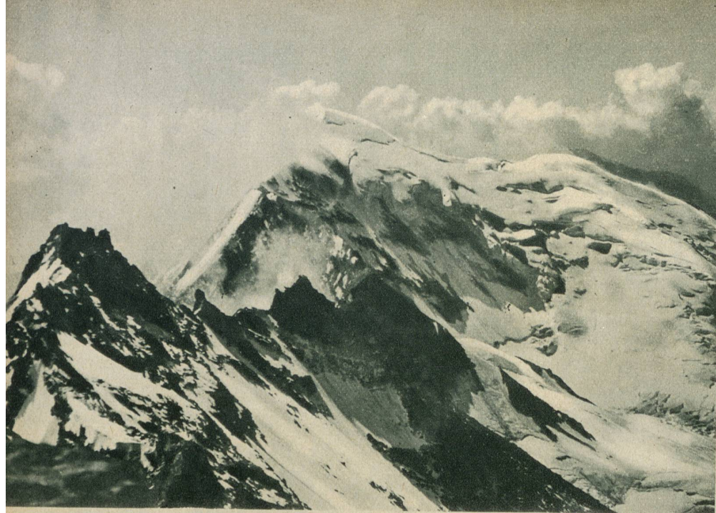
Blick vom Gipfel des Laquinhornes auf das benachbarte Weissmies

wir gezwungen waren, die Besteigung wegen allerlei widriger Umstände auf halbem Wege abubrechen. Vier Jahre später hatte ich nicht viel mehr Glück mit einer Besteigung des Laquinhornes, das sich ebenfalls höchst ungnädig benahm und den ganzen Tag in dichten Nebel hüllte. Das Hotel Weissmies hatte zwar unterdessen seine Preise etwas zivilisiert, aber man musste trotzdem noch recht tief in die Tasche greifen, um die Rechnung zu begleichen. Zwei Jahre verflossen und wiederum nächtigte ich in dem unterdessen Klubbhütte gewordenen Hotel. Diesmal ärgerte uns das Fletschhorn, indem es sich hinter einem Felsgang in stockdunkler Nacht verschanzte. Wir erreichten dann doch noch seinen Gipfel, aber zur geplanten Ueberschreitung des Laquinhornes reichte die Zeit nicht mehr.