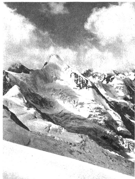
Das Obergabelhorn vom Aufstieg zum Zinalrothorn aus gesehen