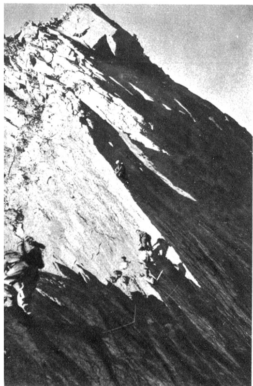
Kletterei am Weissmies-Nordgrat

Der folgende Tag sah uns bereits recht früh im Anstieg zum Täschhorn. Diesmal aber galt es nicht Felsen, wohl aber zum Teil ungemein steile Schnee- und Eiswände zu bewältigen. So kamen denn Pickel und