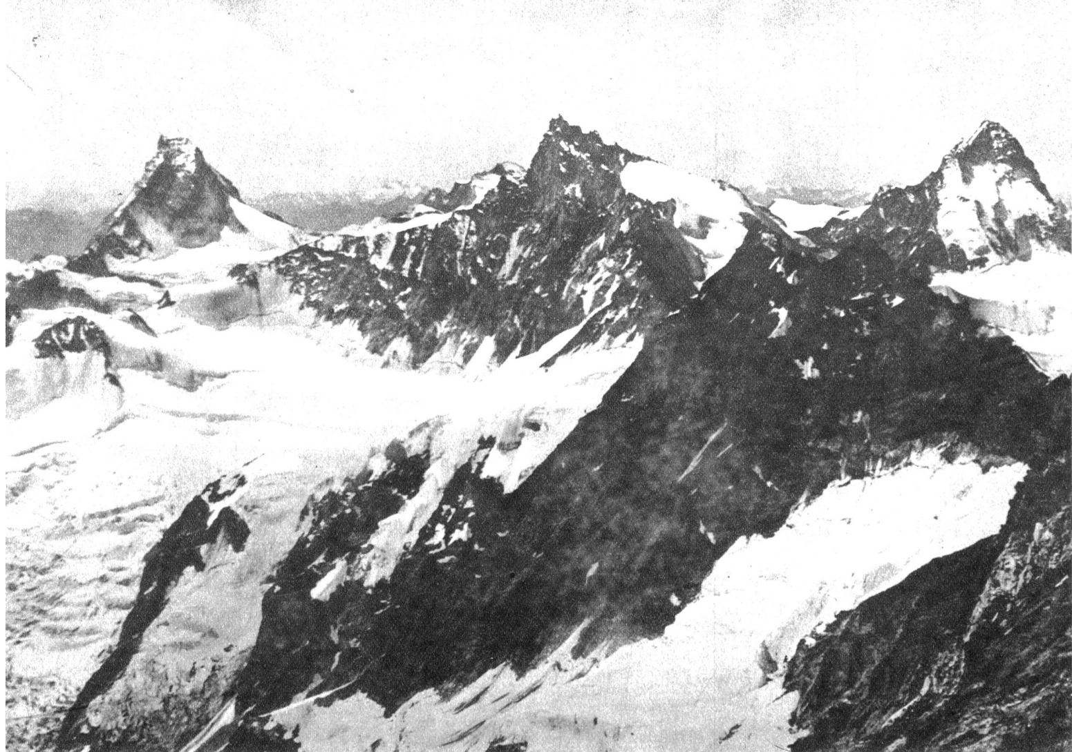
Matterhorn – Zinalrothorn – Dent Blanche vom Ostgrat des Weisshorns aus

Seilhilfe. Als wir nach zehn vollen Stunden endlich auf dem sich eben in den üblichen Nachmittagsnebel hüllenden Gipfel anlangten, begriffen wir, dass der begangene Grat mit Recht seinen Ruf trägt, lang und schwierig zu sein. Ueber den Zwischenbergenpass erreichten wir gegen Abend die Almagelleralp, deren Gasthaus uns, obschon es sonst geschlossen war, ausnahmsweise seine Pforten öffnete. Ebenso ausnahmsweise hatte sich für einmal der Himmel mit finsternen Gewitterwolken überzogen, und während der Nacht sorgten Blitz und Donner ergiebig, dass man sich des weichen Bettes in wachem Zustande erfreuen konnte.