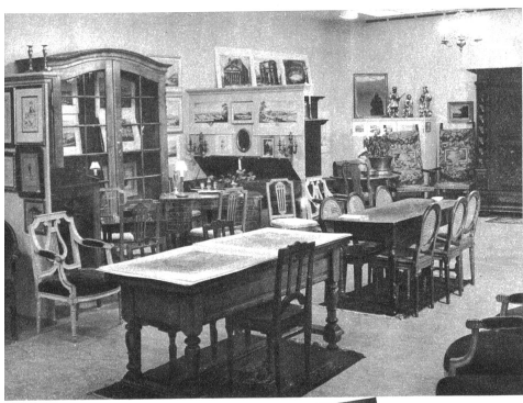
Oben: Ansicht der Galerie Jürg Stucker