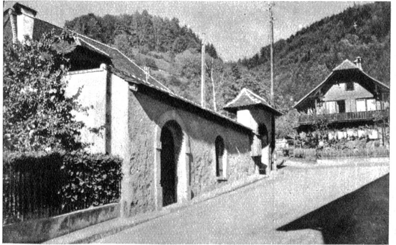
Der Eingang zum „Klösterli“ Oberhofen