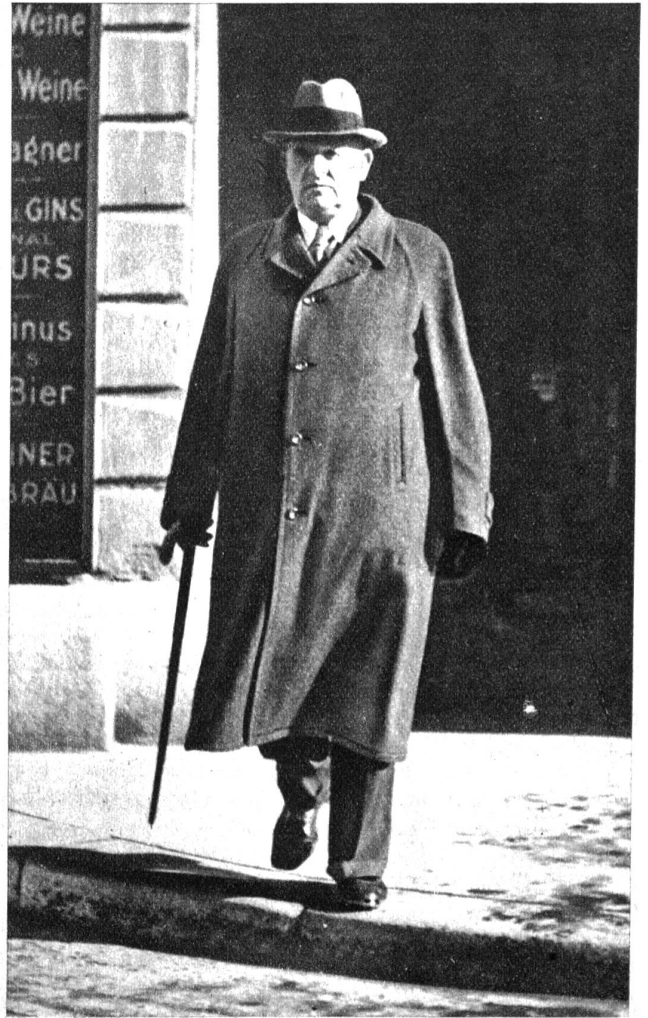
Rechts: Der Bundespräsident für 1944, Bundesrat Dr. Walter Stampfli, auf dem Heimweg

von Sohn, der dafür Heimarrest haben sollte, um sich aufs Gymnasium vorzubereiten. Aber, weisst ja, Kamerad, wenn man als Vagant geboren wurde, altes Soldatenblut in den Adern hat..., mein Grossonkel führte das Regiment von Wattenwyl in England drüben..., da heisst rasten — rosten! Und drum bin ich ausgezogen, wieder einmal auf eigne Faust Mutter Helvetia in die Falten und Runzeln zu gucken, oder vielmehr, ihre ewigjunge Natur, die Haller wundervoll besang, zu bewundern. Verhüllt sie nun extra mir zur Strafe das Wytenalphorn mit siebenfachen grauen, nassen Schleiern, was meinst, Kamerad? "