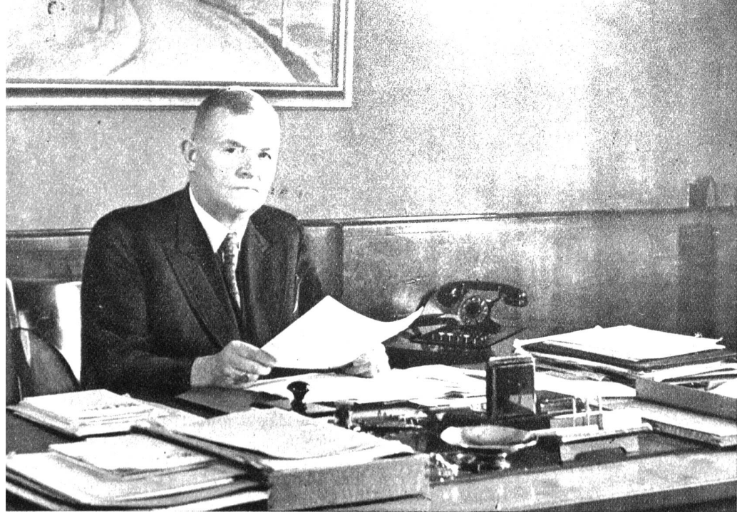
Der Bundespräsident in seinem Büro des Volkswirtschaftsdepartementes

1884 in Büren (Kanton Solothurn) geboren. Er studierte Nationalökonomie und Rechtswissenschaft an den Universitäten von Zürich und Göttingen und promovierte zum Doktor der Volkswirtschaft. Dr. Stampfli war zuerst im Versicherungsfach tätig. Von 1908—1918 war er Redaktor am «Oltener Tagblatt», von 1918—1921 Sekretär der solothurnischen Handelskammer. Im Jahre 1921 kam er als Direktionssekretär zur Gesellschaft der L. v. Roll'schen Eisenwerke in Gerlafingen, deren Direktor er 1929 wurde.