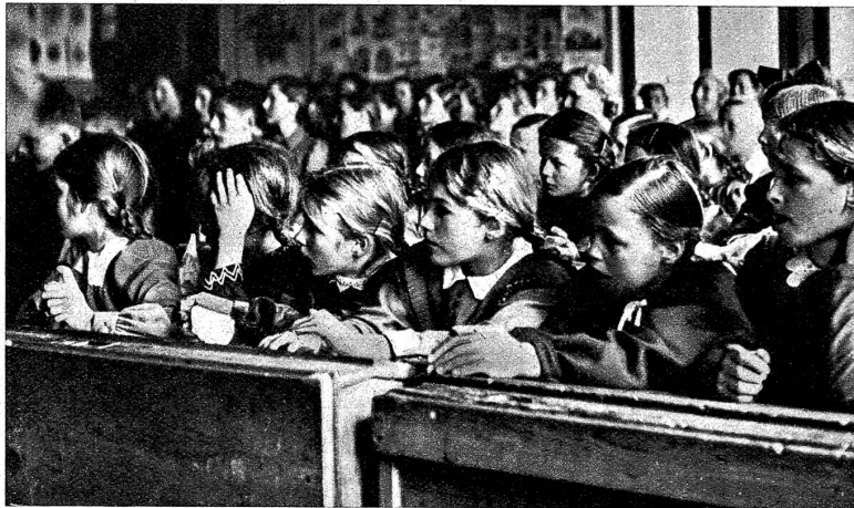
Examenstag im Kandertal. Dichtgedrängt sitzen die 3 Klassen an diesem Tag in einem Zimmer zusammen

Rechts: Von den Mitgliedern der Schulkommission wird der Examenbatzen gespendet