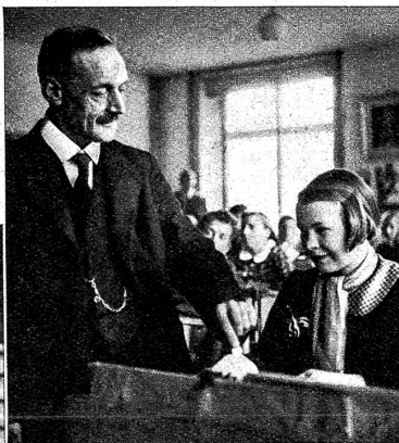
Rechts: Der Herr Lehrer stiftet jedem Kind eine Tasse Kaffee. Dazu werden Lebkuchen und Chrömlli gegessen, die man an diesem Tag vor dem Schulhaus kaufen kann

Unten: Vor dem Schulhaus wartet die Gutzlifu, bis die Kinder in der Pause Naschereien kaufen. Für die Jugend gehört der Kauf von Lebkuchen zum Schönsten an diesem Examenstag