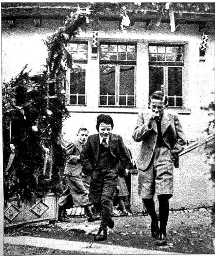
Unbeschwert von Sorgen stürmen die Knaben nachher aus der Schule ins Leben