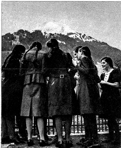
Die Schulleistungen werden verglichen und kritisiert

Als Abschluss des Exams wird noch frisch und froh ein Lied gesungen