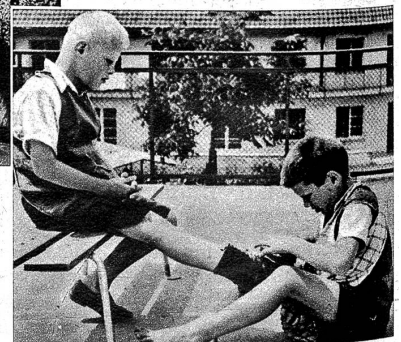
Rechts: Schwachsinnige Kinder werden zur Selbstständigkeit und gegenseitiger Hilfe erzogen

Ein besonders gütiges Geschick hat uns bis heute vom Krieg und seinen Leiden bewahrt und wir dürfen uns der schönen Pflicht hingeben, überall da zu helfen, wo wir es mit unserer Verbindung ermöglichen können.