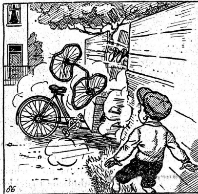
86. Rrrr! da rannte Miezech bereits zum Garten hinein, immer mit dem Hund auf den Fersen. Bums! Ein dröhnender Schlag folgte; das Dreirad war nämlich zu breit für die Türöffnung, wenigstens das Rädergestell war's. Die Räder wurden glatt abrasiert, während der Rest des Dreirads krachend durch die Oeffnung glitt. Durch den Stoss machten unsre beiden Freunde ihren sovielesten Luftsprung.