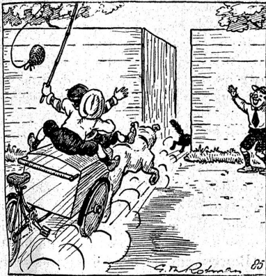
85. Nachdem die Katze die ganze, ansteigende Strasse hinaufgerannt war, erkannte sie plötzlich ihr Haus wieder: drüben stand noch immer die Gartentür offen, durch die sie vor einigen Minuten hinausgeflüchtet war. Näher und näher kam die rettende Tür... würde sie sie noch rechtzeitig erreichen?

von G. Th. Rotman (Nachdruck verboten) 14. Fortsetzung