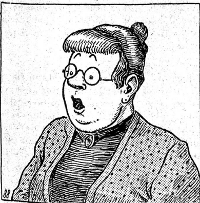
88. Auf einmal aber wurde die arme Frau rot vor Scham. « O weh! » rief sie aus, da habe ich vergessen, Kuchen holen zu lassen, und das Mädchen ist schon fort! « Oh, das bedeutet gar nichts, gnädige Frau! » sagte Herr Wassermeier, aber das sagte er nur höflichkeitshalber, denn er wusste das Gebäck des Konditors sehr zu schätzen.