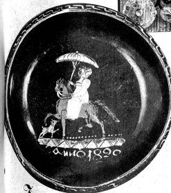
Rechts: Weingelbe aus dem Oberland

Im Rahmen der schweizer Kunstausstellung wurde am 16. Mai in der Kunsthalle Bern eine Schau der historischen bernischen Volkskunst eröffnet. Es ist dies für unsere Kantone die erste derartige Veranstaltung und dürfte für weite Kreise ein eindrucksvolles Ereignis werden. Volkskunst war früher vor allem Bauernkunst. Der bäuerliche Geist und die bäuerliche Lebensführung bilden ihre Grundlage. Träger der Volkskunst war in erster Linie der Handwerker und nur ausnahmsweise der Bauer selbst. Wohl zum Teil vergriffen, was die bernische Volkskunst hervorgebracht hat, gehört die Befähigung des einfachen Volksgenossen mit dem Meister. Jahrhundertlange Arbeitsmittel und -weisen sind hier bis in die Feinheit auf den Trüben und Mühen, Kräftigen und Geschicklichen aus feinstem Berggips.