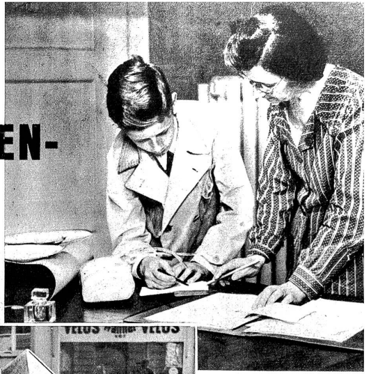
Oben: Der „Bub“, wie er im Geschäft genannt wird, rüstet sich zum ersten fäglichen Gange. Diesmal ist es eine bescheidene Ladung