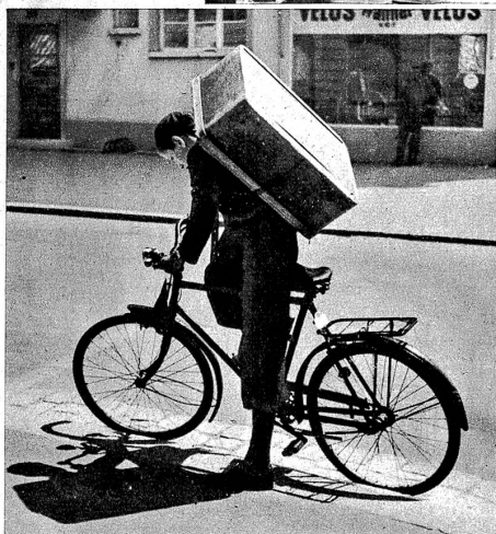
Links: Nun geht's auf die Tour. Die Sonne brennt tüchtig auf den hölzernen Buckel und macht ihn dann manchmal doppelt schwer

Wenn wir der vielen Arbeitskategorien, die zusammen unsere zahlreichen und mannigfaltigen Geschäftsbetriebe ausmachen, vor unseren Augen Revue passieren lassen, da dürfen wir des untergeordnetsten der «Aemter» nicht vergessen. Wir meinen den «Wochenplatz».