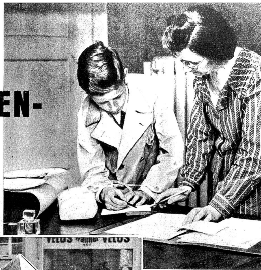
Oben: Der „Bub“, wie er im Geschäft genannt wird, rüstet sich zum ersten fäglichen Gange. Diesmal ist es eine bescheidene Ladung