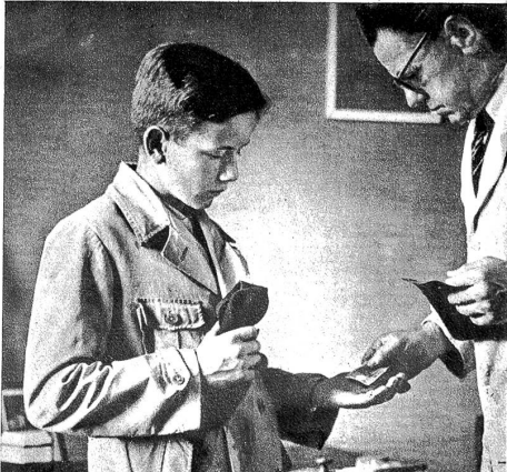
Links: Zahltag! Der schönste Moment der Arbeitswoche. Der hilft über die Mühsale mancher struben Tage hinweg