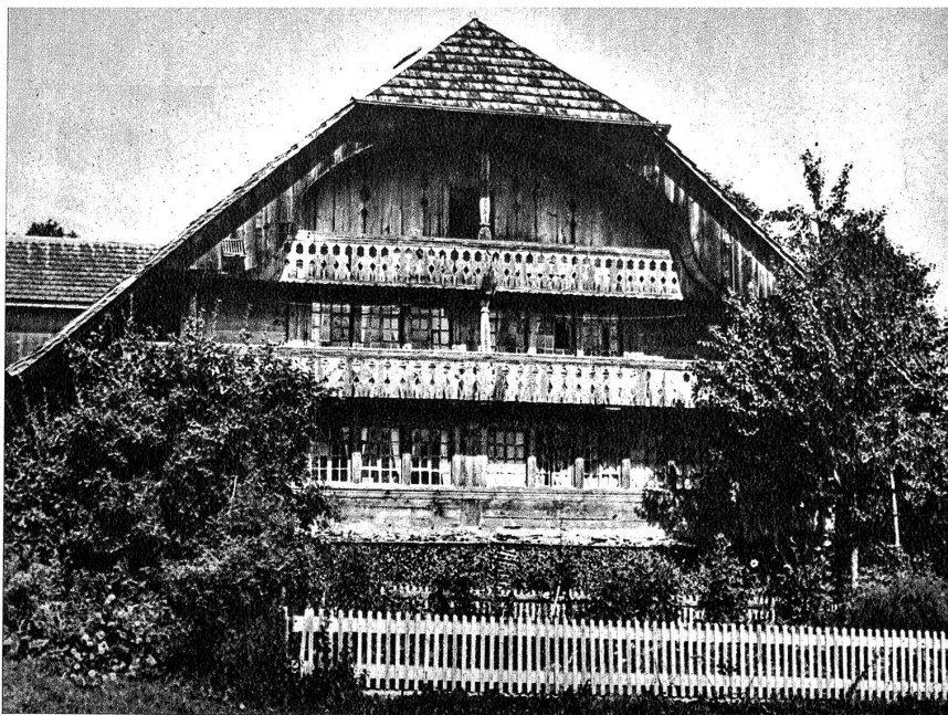
Die Scheitermatt in Blumenstein. Der ganze Wohnteil des Hauses ist noch gut erhalten. Die zierliche „Rüdi“ mit der durchlocherten Stirnwand, die ausgeschnittenen schönen Lauben, die Scheiterbeige und der Gartenzaun, besonders aber die blitzblanke Fensterfront mit den kleinen Scheibchen verleihen diesem Haus das, was der Berner unter „heimelig“ versteht

Über «Das Gürbetal und sein Bauernhaus» schreibt Paul Howald. Er schreibt aber nicht nur, er zeigt uns in vielen ganzfertigen, vorzüglich widergegebenen Bildern all die Schönheiten, die uns das